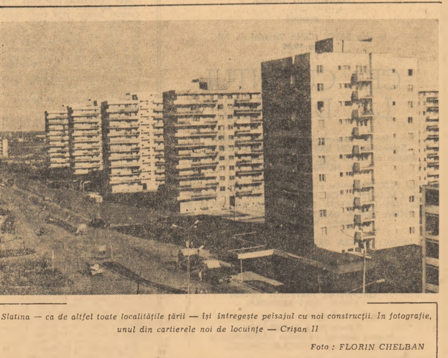
Slătina — ca de altfel toate localitățile țării — își întregesc peisajul cu noi construcții. În fotografie, unul din cartierelor noi de locuințe — Crișan 11

● SILVICULTORII din județele Mureș și Harghita — zone în care pădurile ocupă mari suprafețe — anunță noi succese în acțiunile de refacere și dezvoltare a patrimoniului forestier. Ei și-au îndeplinit sarcinile pe întregul an la împădurire, realizînd plantații noi pe 2.760 ha, cu peste 200 ha mai mult decît prevederile de plan. Silvicultorii din această parte a țării, care și-au onorat sarcinile pe întregul cincinal înec de la începutul anului, au împădurit cu plantații noi, din 1971 și pînă în prezent, 15.450 ha. În același timp, s-au făcut lucrări de întreținere și completări pe plantațiile tinere pe circa 90.000 ha de păduri.