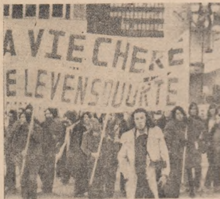
BELGIA — Aspect din timpul unei recente manifestații desfășurate la Bruxelles împotriva creșterii alarmante a costului vieții

actelor de violență în ansamblul filmelor și programelor de televiziune din S.U.A. Filmele, piesele de teatru și alte emisiuni prezentate pe ecrane care conțin scene înfățișînd asasinat, jafuri, torturi și alte acte de violență reprezintă circa 54 la sută din totalul producțiilor de televiziune. Densitatea de îngrijorătoare