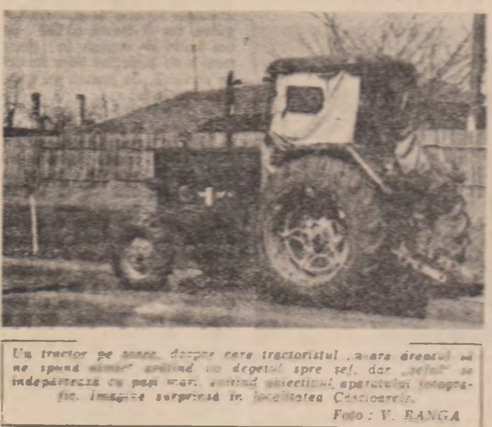
Un tractor pe șosea, după ce a terminat lucrările în zona de semănt...