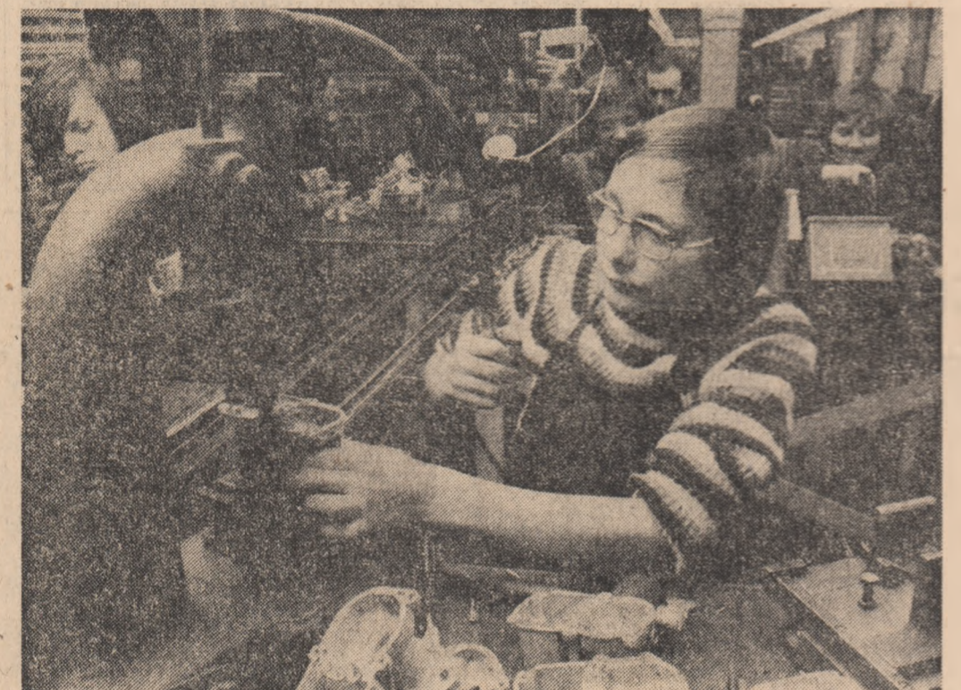
R. D. GERMANĂ — În imagine, elevi ai unei școli politehnice din Berlin în timpul orelor de practică productivă la Uzinele de filtre și carburatoare din capitală