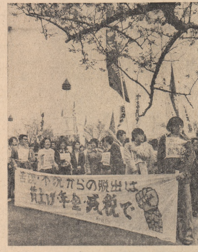
JAPONIA — Un mare miting urmat de o amplă demonstrație pe străzile capitalei nipone a avut loc recent în parcul Yoyogi din Tokio. Cei aproximativ 55.000 de participanți la această acțiune revendicativă, organizată în cadrul „ofensivei de primăvară”, s-au pronunțat pentru eludarea completă a cazurilor de corupție implicate în afacerea „Lockheed”, pentru măsuri eficiente în lupta împotriva inflației și șomajului. În fotografie: imagine din timpul mitingului desfășurat în parcul Yoyogi din Tokio.

Lucrările reuniunii de la Paris continuă, urmând să se încheie vineri.