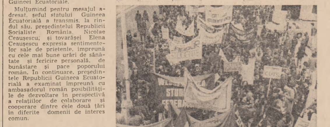
ANGLIA: Demonstrație a studenților împotriva reducerii alocațiilor destinate învățămîntului

Deplasat în teritoriul în parte a anului, Vittorio Winspeare-Guicciardi, reprezentantul secretarului general, a elaborat un raport care se află în atenția membrilor Consiliului. Guicciardi nu s-a putut consulta — se precizează — decât cu organizațiile politice (pro-