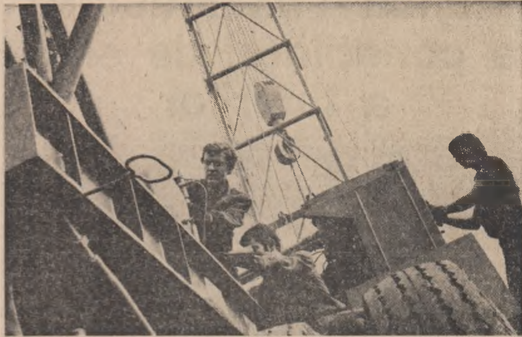
O ultimă și exigentă verificare și o nouă instalație de foraj, realizată de colectivul Întreprinderii „1 Mai” din Ploiești, este gata de expediere

Cu acest prilej, a avut loc o convorbire care s-a desfășurat într-o atmosferă cordială.