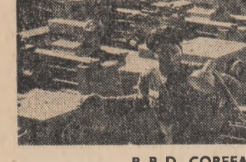
R. P. D. COREEANĂ. Imagine de la Uzina de mașini-unelte Kusong