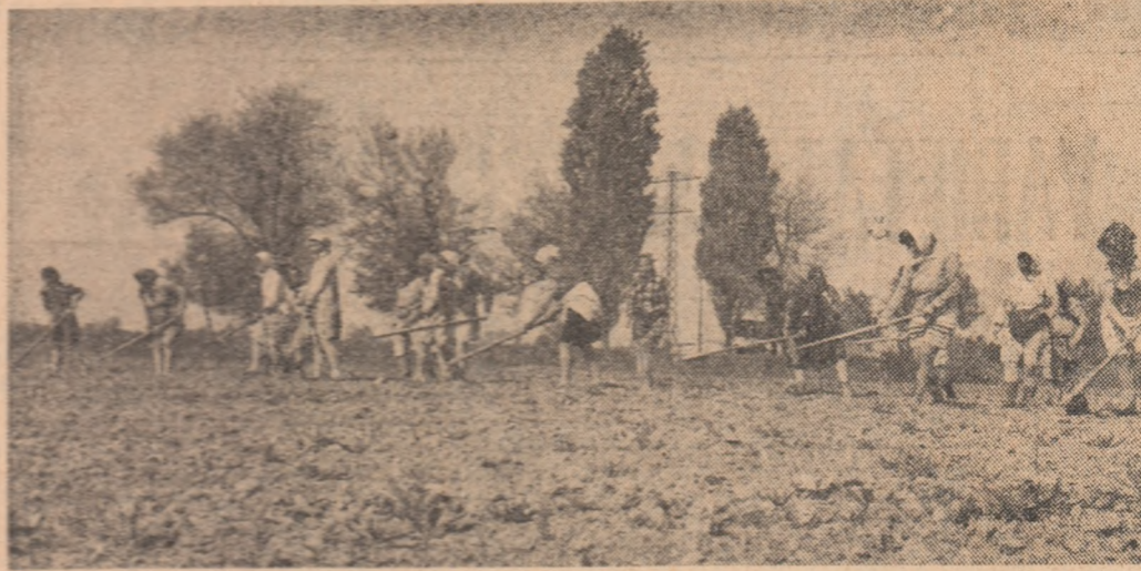
Toate forțele setului sînt concentrate acum la întreținerea culturilor prășitoare.