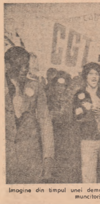
Imagine din timpul unei demonstrații desfășurate la Paris de muncitorii emigranți