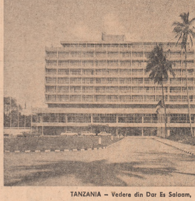
TANZANIA — Vedere din Dar Es Salaam, capitala țării