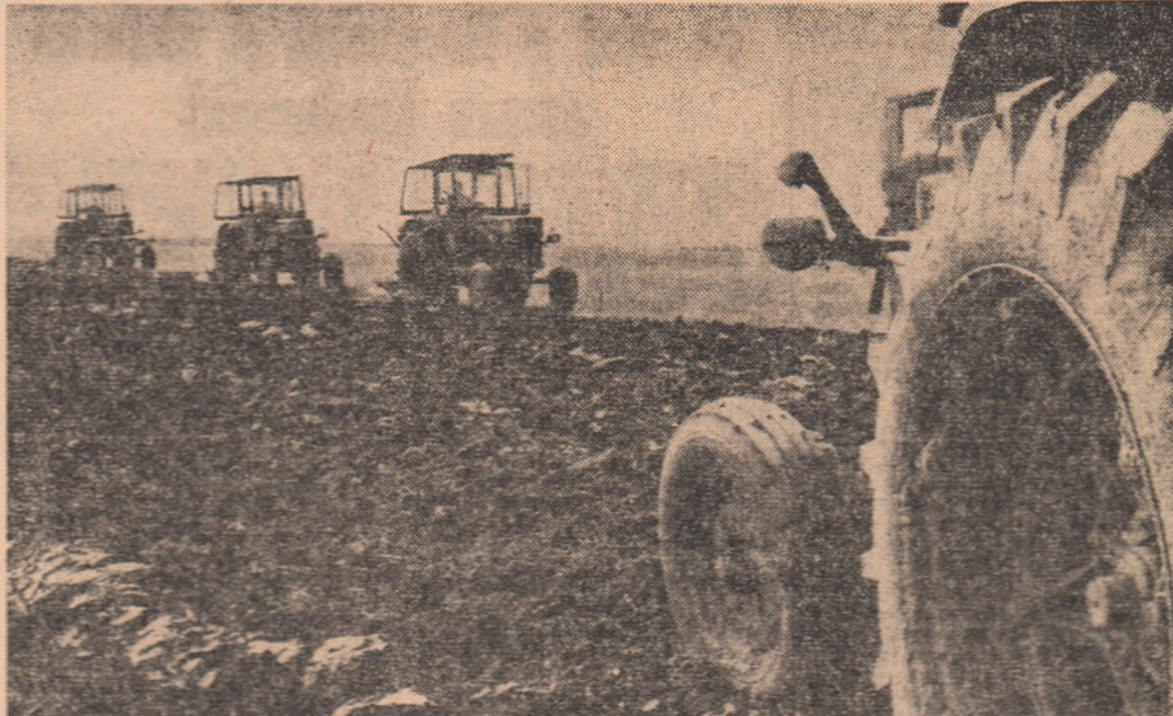
Peste 100.000 ha vor fi semănat cu porumb boabe, a doua cultură, după mazăre verde. De aceea, arătăm în imagine, la C.A.P. Bucșani, județul Dimbovița, discuții și însemnările trebuie organizate în flux continuu.