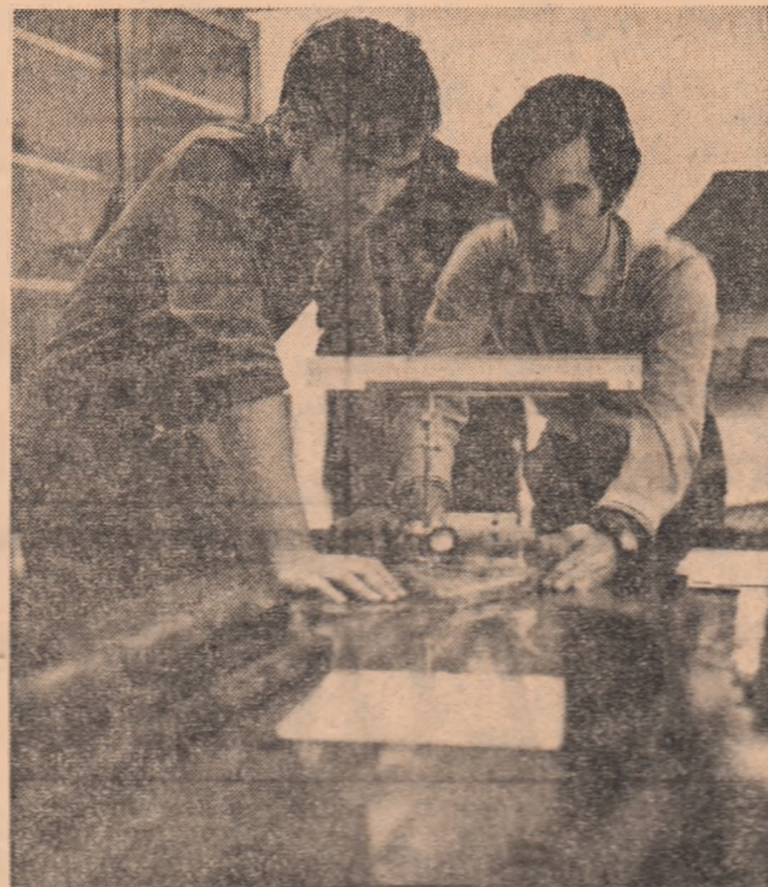
În laboratoarele Facultății de electrotehnică de la Universitatea din Cluj-Napoca