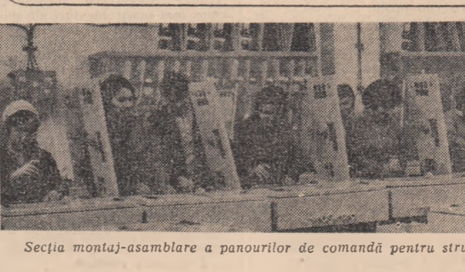
Secția montaj-asamblare a panourilor de comandă pentru strunguri de la I.P.T.E. Alexandria

„Bucuria muncii”. În se numea baletul tinerilor de la Fabrica de fire sintetice din Sîrbeni; decorația concretă a frumuseții lor muncii, a problemelor care se nasc, zi de zi, de la cele de ordin tehnico-administrativ pînă la cele de ordin moral, se transformă inevitabil în înaltă poezie. Formajunile de dansuri tematice, brigăzile de agitație, echipele de teatru au izbucnit, unindu-și eforturile și lăcărurile, să ne înfășureze o adevărată cronică, foarte la curent, a vieții de fiecare zi a tineretului. Cine urmărește aceste spectacole știe ce au realizat, ce gîndesc, ce probleme au tinerii.