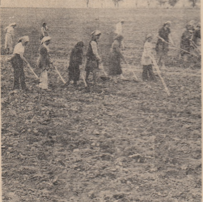
Campania agricolă cunoaște în această perioadă o intensitate deosebită prin mobilizarea tuturor forțelor satului, pe întreaga durată a zilei, la efectuarea lucrărilor de întreținere