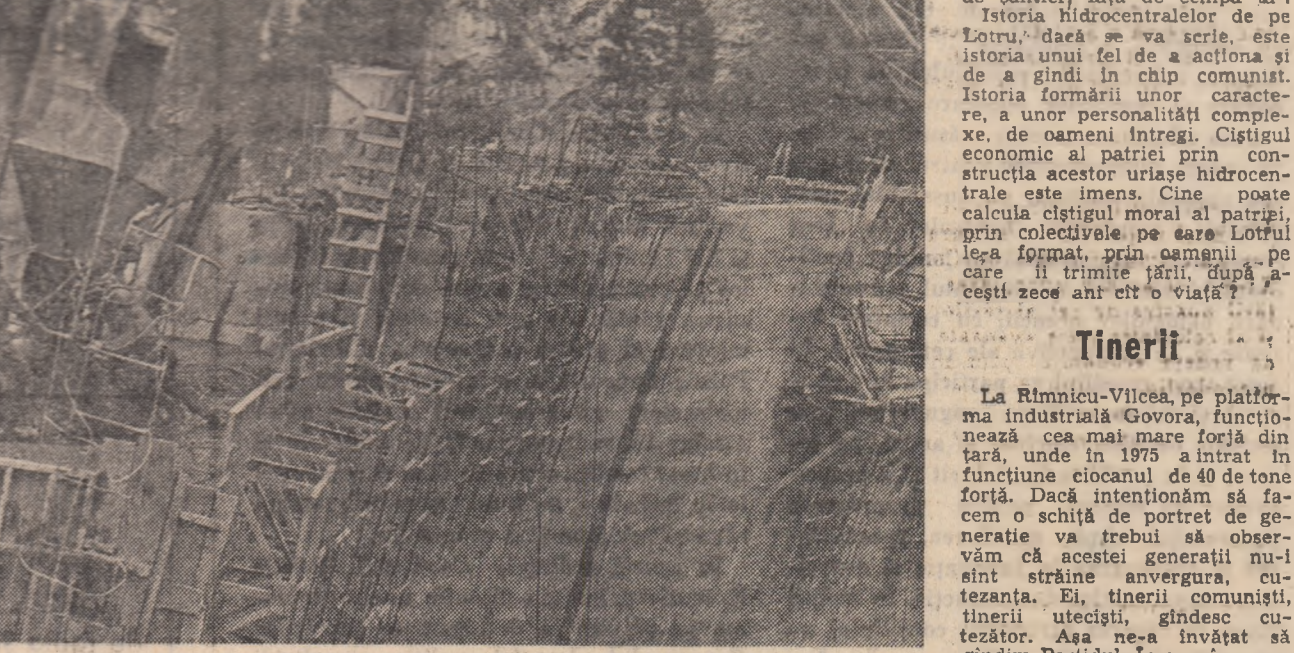
Lotru: Epopeea conștiinței