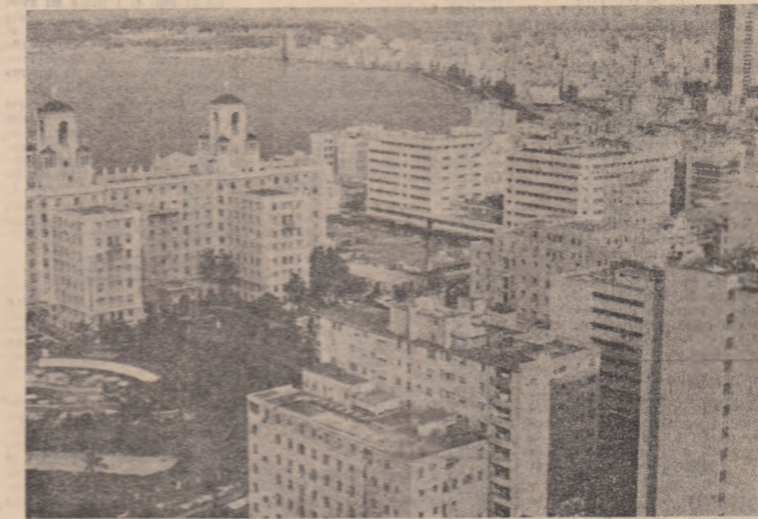
CUBA - Vedere din Havana

● INTR-UN comunicat oficial dat publicității la Brasília se evidențiază că o serie de companii transnaționale care acționează în țara noastră răspund pentru creșterea deficitului balanței comerciale a Braziliei în ultimii ani. Documentul arată că, din totalul deficitului comercial înregistrat în 1974, peste 2 miliarde dolari se datoresc activității nesatisfăcătoare a 115 companii străine care acționează în țară.