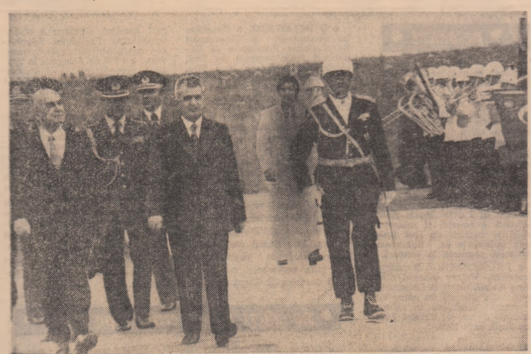
În timpul trecerii în revistă a găzii de onoare

Excelență, Este știută, desigur, de vecinii noștri și de întreaga lume importanța Mării Egee din punctul de vedere al Turciei. Doresc să precizez îndeosebi că Turcia