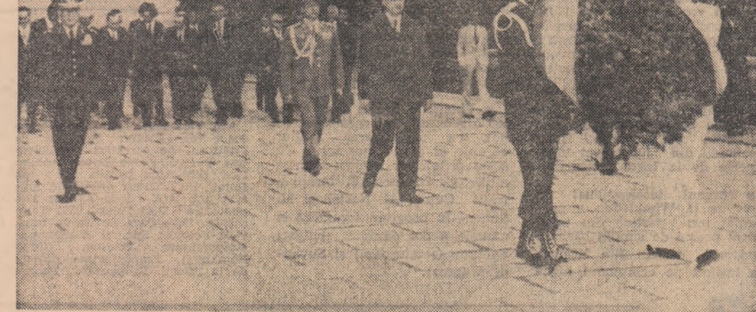
La Mausoleul lui Mustafa Kemal Atatürk

Cu acest prilej, au fost discutate probleme privind dezvoltarea cooperării dintre România și Turcia în domeniile minier, petrolului și geologiei.