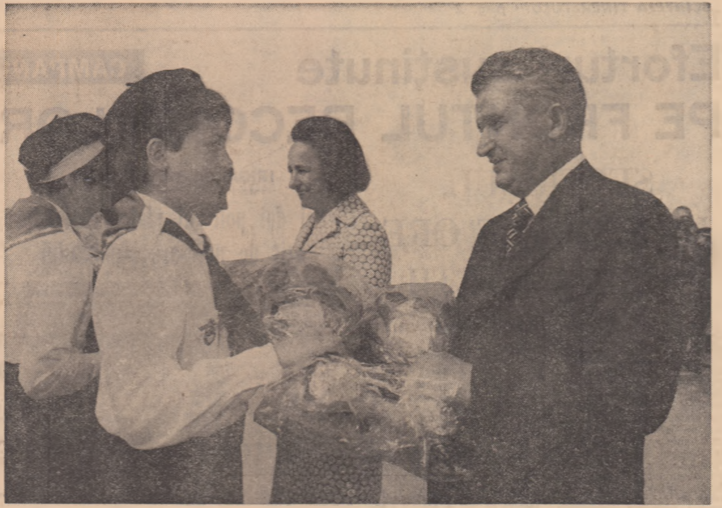
La plecarea, pe aeroportul Otopeni

Un nou moment de mare însemnătate în cronica relațiilor de colaborare prietenească româno-turce, o contribuție de seamă la cauza păcii și înțelegerii în Balcani, în Europa și în întreaga lume