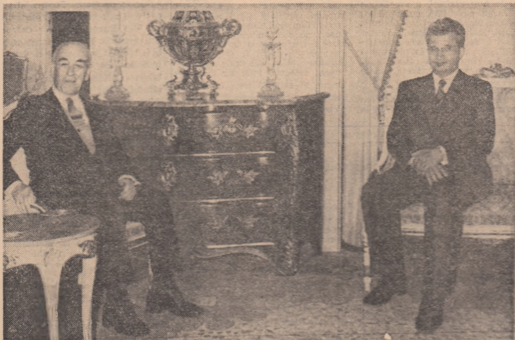
În timpul vizitei protocolare

IN PAGINA A 3-A: Toasturile rostite de președintele Fahri Korutürk și președintele Nicolae Ceaușescu