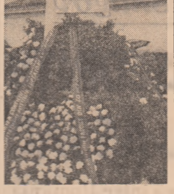
reștință națională, să întîmdeze oameni muncii, care nutreau o ură nemărginită față de fascism. Crimele și execuțiile, ca și lagărele de concentrație nu au putut îngenunchia rasa noastră...