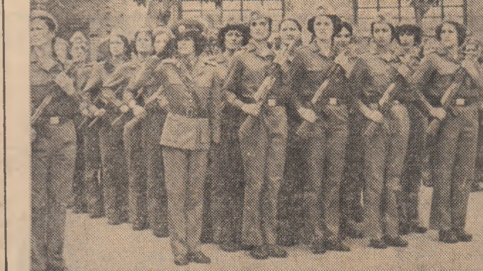
reștință națională, să întîmdeze oameni muncii, care nutreau o ură nemărginită față de fascism. Crimele și execuțiile, ca și lagărele de concentrație nu au putut îngenunchia rasa noastră...