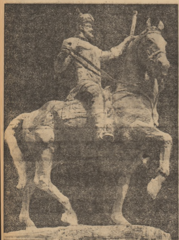
Florin Codre: „MIHAI VITEAZUL”

În epopeea istoriei noastre, domnia lui Mihai Viteazul ocupă un loc de excepție. Domnia lui este remarcabilă nu numai prin realizările politice și militare, ci mai cu seamă, prin aceea că înfăptuirile sale s-au îndreptat spre idealurile imobile ale țării române de epocă, deci de destinul național al poporului român. Domnia lui Mihai Viteazul, prin caracterul său revoluționar și prin înfruntarea unor năzuințe visate de un popor întreg, ca să-și revindă dimensiunile lor, sens de simțăminte, Mihai Viteazul apare pe scena istoriei românești într-un moment când speranțele unei redresări pentru noi erau aproape nule, îndeosebi datorită faptului că la sfârșitul secolului al XVI-lea Porția, puterea oprită asupra noastră s-a întors spre centrul Europei, ostilitățile otomane cucerind cetățile care le deschideau drumul în Viena. În asemenea împrejurări, recomandarea prudentă și înțeleaptă a lui Viteazul a fost să stea pe linia de independență. Executarea cămărilor aflați în țară și arderea castrelor în care erau conținate dotările reprezintă un moment revoluționar. Chemarea țării la luptă solidarizează în ju-