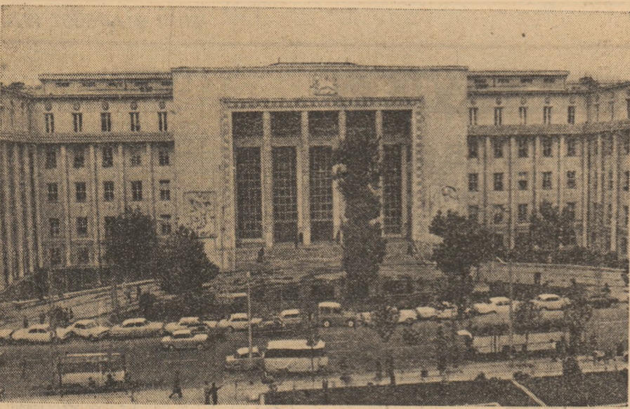
IRAN - Vedere din orașul Teheran, capitala țării

● DUPĂ cum informează agenția China Nouă, a fost reparată și pusă în funcțiune feroviară importanta linie Pekin - Sanhai-kuan, grav avariată în urma cutremurului care a afectat la 28 iulie zona Tangșan - Fengnan. Trezind prin orașul Tangșan, această linie leagă regiuni din nordul și nord-estul R.P. Chineza, iar violentul cutremur i-a provocat numeroase stricăciuni pe porțiunile însumând circa 230 kilometri. Selsmul a avariat, de asemenea, o serie de poduri feroviare de pe acest traseu, care au fost și ele reparate. A fost, totodată, redată traficului gara Tangșan, prin care au putut trece, dinspre Pekin și alte localități, trenuri încărcate cu ajutoare destinate regiunilor care au avut de suferit de pe urma seismului.