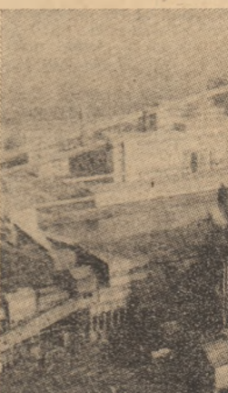
R. D. GERMANA: Imagine a Combinatului Siderurgic Est de pe Oder

toarele sondei spațiale, cît și pe pămînt, unde o echipă de specialiști a început deja repetarea analizelor efectuate de „Viking-1”, pînă în prezent, utilizînd materiale geologice aproape similare celor găsite pe Marte. Vor fi, de aceea, necesare, cîteva săptămîni, dacă nu chiar și luni, pentru a preciza, fără riscul unei erori, dacă forma de viață există sau nu pe Planeta roșie - apreciază biologii echipei de la Pasadena.