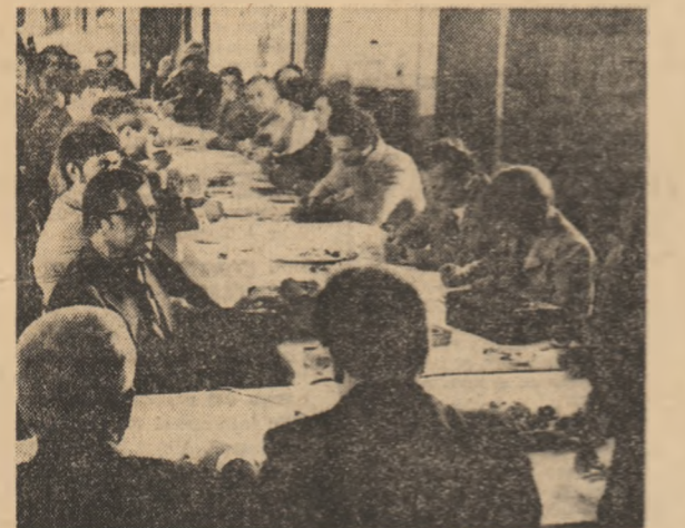
Aspect de la întâlnirea cu presa română și sovietică