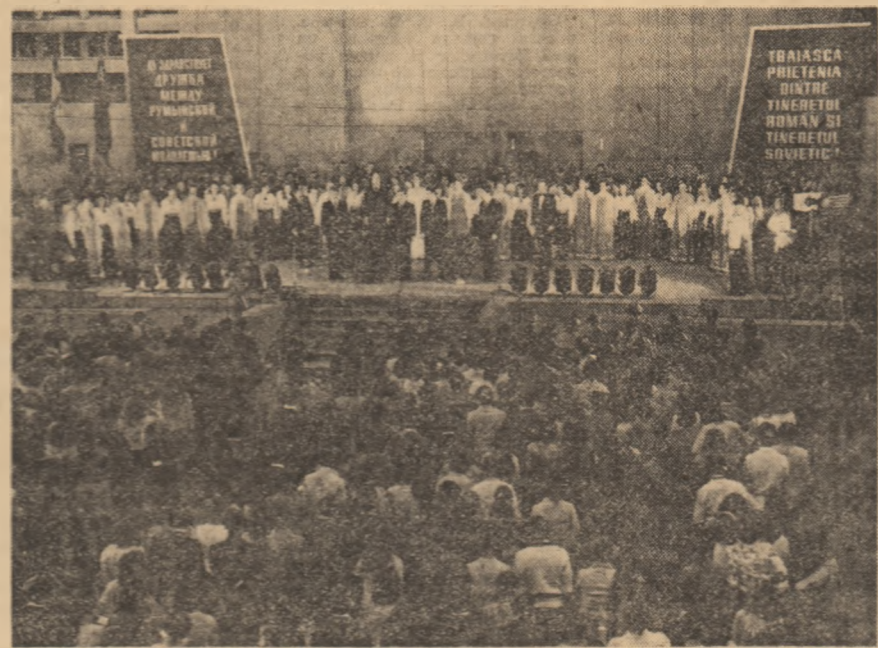
Spectacolul comun de gală al formațiilor artistice românești și sovietice

Sistemul cu totii — a spus în continuare vorbitorul — sub puternică impresie a caldilor cuvinte adresate participanților la întâlnirea noastră prietenească de tovarășii Nicolae Ceaușescu, secretar general al Partidului Comunist Român, președintele Republicii Socialiste România, și de tovarășul Leonid Ilici Brejnev, secretar general al Comitetului Central al Partidului Comunist al Uniunii Sovietice — exprimate a do-