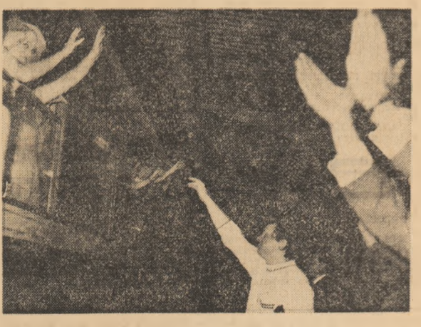
La plecare, pe peronul Gării de Nord

Grupaj realizat de GH. SPRIETORIU, BAZIL ȘTEFAN și GEORGE CUCU