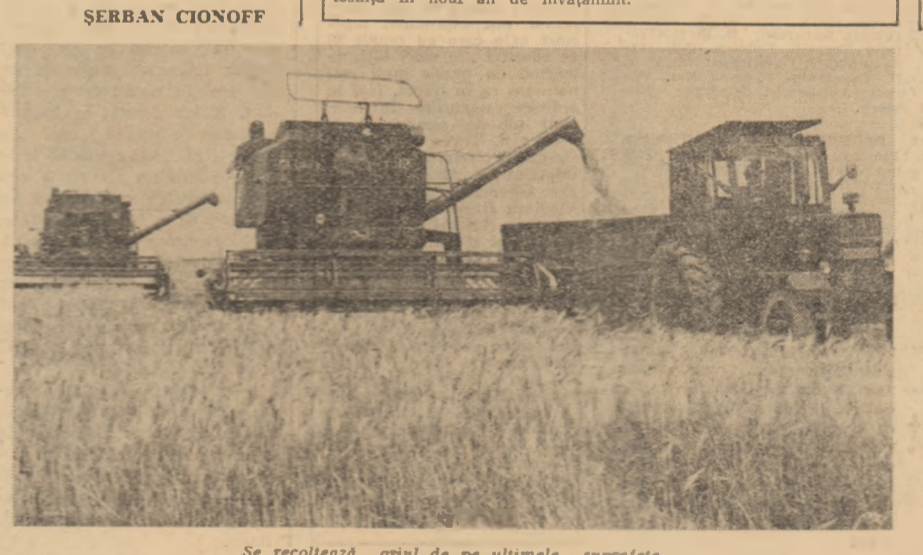
Se recoltează gruiul de pe ultimele suprafețe.

250 de tineri din întreprinderea U.F.E.T. Bocșa, I.C.M.M. Reșița și întreprinderea „Otelul Rosu” au organizat în cinstea apropriei sărbătorii de la 23 August sase schimburi prelungite. Valoarea produselor realizate în cadrul acestor inițiativ se ridică la 12 500 lei. (Dumitru Ursu)