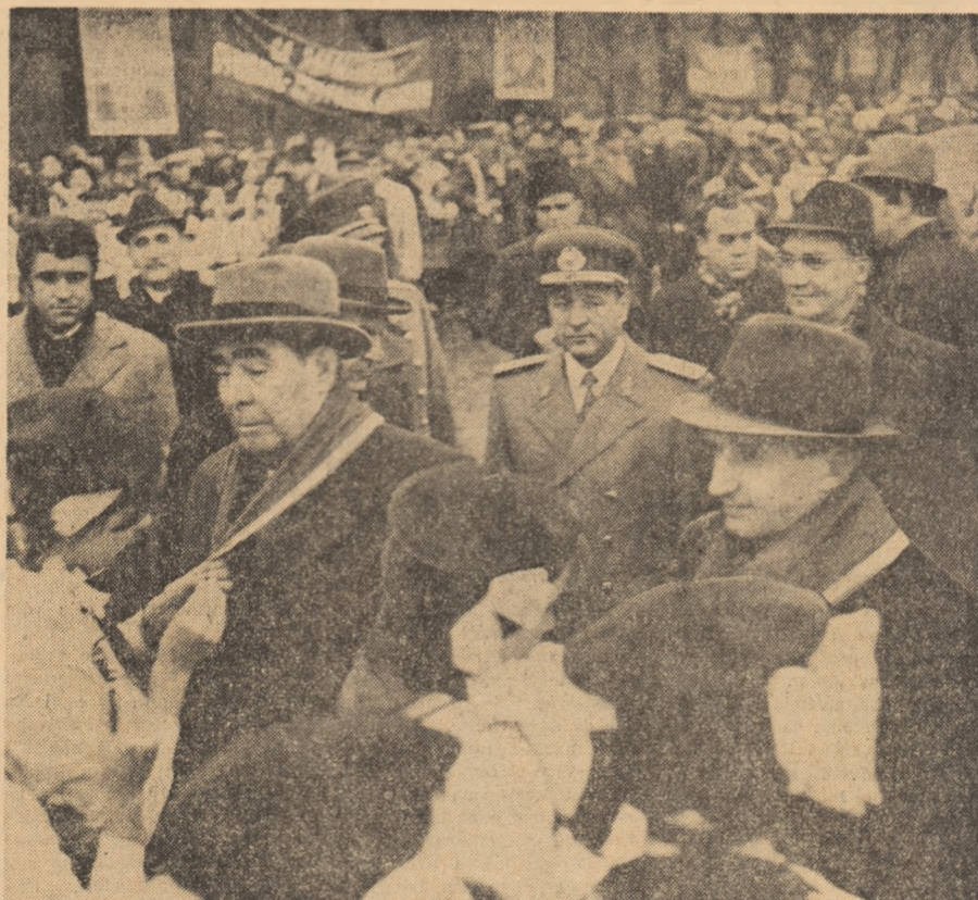
În Piața Victoriei, reprezentanții tineretului generației oferă tovarășilor Nicolae Ceaușescu și Leonid Ilici Brejnev, insigne și cravate pionierești