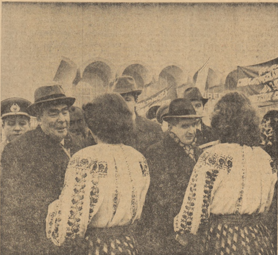
Flori ale prieteniei, manifestări ale sentimentelor frățesti dintre cele două popoare vecine și prietene