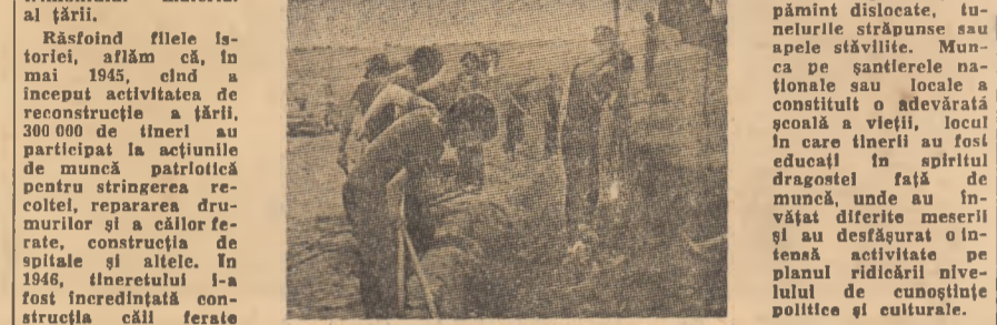
Correspondență din Belgrad

meiri și acesta rod al muncii patriotice a tineretului. În anii următori au fost organizate acțiuni de muncă patriotică pe plan republican și local, iar în 1958 tineretul și-a asumat construirea autostrăzii Braștovo — Iedinstvo, pe secțiunea Ljubljana — Zagreb și Belgrad — Djevdjela, acțiune încheiată în 1963. Această autostradă, construită de 1500 tineri veniți din toate colțurile țării, Timbra generație a muncii pe șantierul „Magistralei Adriatice”, pe șantierul căii ferate Beograd — Bar, pe șantierul de amenajare a cursurilor râurilor Sava, Drava și Morava. În cel 30 de ani scurși de la construirea liniei ferate Brsko — Banovici, peste două milioane