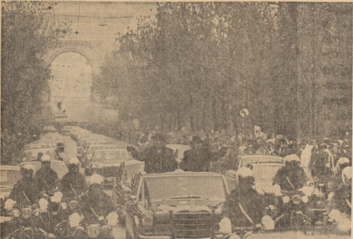
Pe întregul traseu străbătut de coloana oficială, locuitorii Capitalei României au salutată cu căldură, cu sentimente de bucurie și tovarășii Nicolae Ceaușescu și Leonid Ilci Brejnev