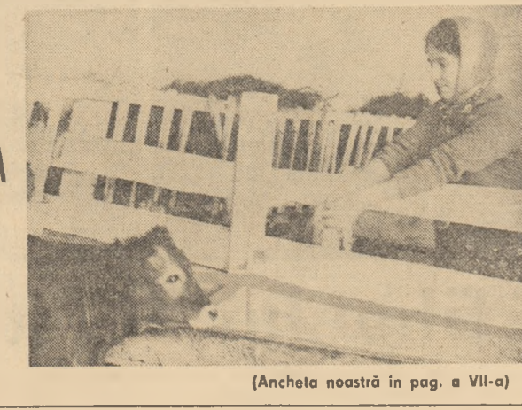
(Ancheta noastră în pag. a VII-a)

ASIGURAREA FURAJELOR ȘI PREGĂTIREA ADĂPOSTURILOR PENTRU ANIMALE