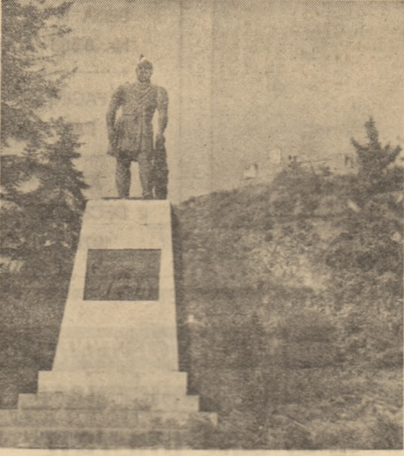
Statuia lui Decabal din Deva - un simbol al luptei poporului pentru apărarea pământului strămoșesc, pentru libertate și neamănare

titate de metal și beton, atinând o greutate de 24.000 tone. Inspirat de stadionul olimpic din München, constructorii vest-germani au imaginat un turn de răcire dantelat, de dimensiuni mult mai mici și o greutate de numai 300 tone.