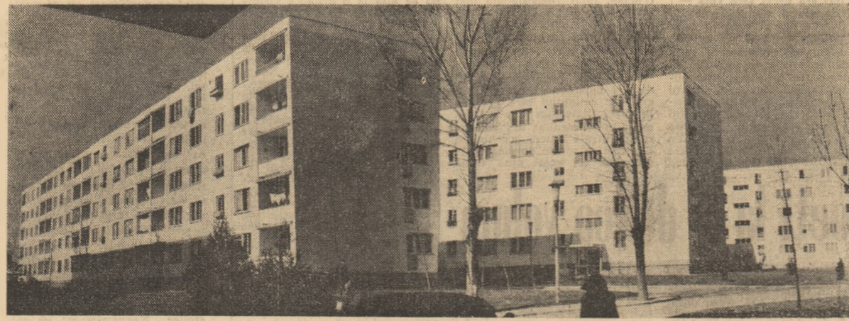
RAHOVA. — Încă o periferie de altă dată se înscrie în noua arhitectură a Capitalei.