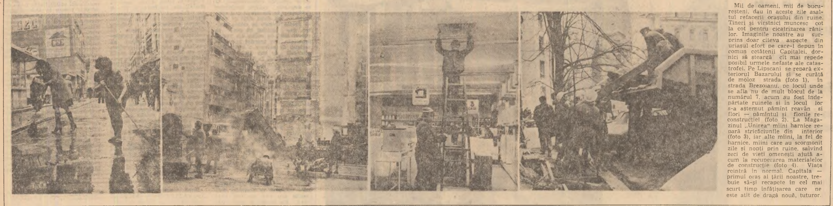
Mii de oameni, mii de bucurii dau în acesti zile asaltul refacerii orașului din ruine. Tineri și vîrstnici muncesc cot la cot pentru cicatrizarea rănilor. Imaginile noastre au surprins doar cîteva aspecte din acest efort pe care-l depun în comun cetățenii Capitalei, dorinți să steargă cît mai repede posibil urmele nefaste ale catastrofei. Pe Lipsani se repară extensivul Bazarului de curăție de moloz strada (foto 1). În strada Brezoianu, pe locul unde se afla nu de mult blocul de la numărul 7, acum au fost îndepărtate ruinele și în locul lor s-a așternut pînă în prezent și flori — rămîntuși și flori reconstrucției (foto 2). La Magazinul „Unirea” miini harnice repară strîcaciunile din interior (foto 3). Iar alte miini, la fel de harnice, miini care au scooromînt zile și nopți prin ruine, salvînd zeci de vieți omenești ajută acum la recuperarea materialelor de construcție (foto 4). Viața revine la normal. Capitala, primul oraș al țării noastre, trebuie să-și recapete în cel mai scurt timp înfățișarea care ne este alt de dragă nouă, tuturor.