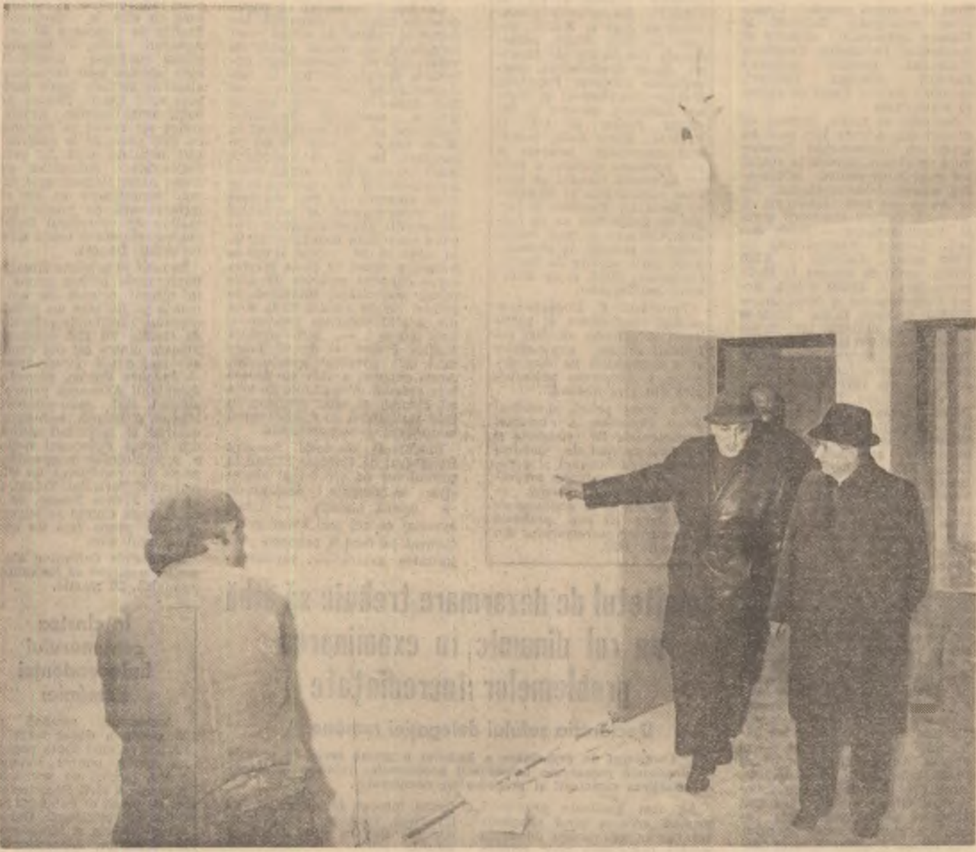
(Urmare din pagina 1)

voate de seism, la efectuarea lucrărilor de consolidare. În cursul vizitei, la blocul de pe B-dul Magheru, în care se află sălile Teatrului Nottara, la imobilul de pe Calea Victoriei nr. 1-5, la cele două blocuri noi de pe bulevardele Armata Poporului și Păcii, unde s-a oprit și într-una din zilele trecute, secretarul general al partidului a purtat un amplu dialog cu specialiștii prezenți la fața locului.