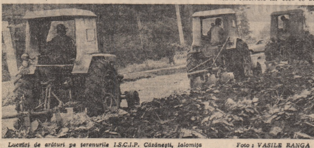
Lucrări de arături pe terenurile I.S.C.I.P. Căzănești, Ialomița.

Am cercat în primul rînd tuturor beneficiarilor să și rî-