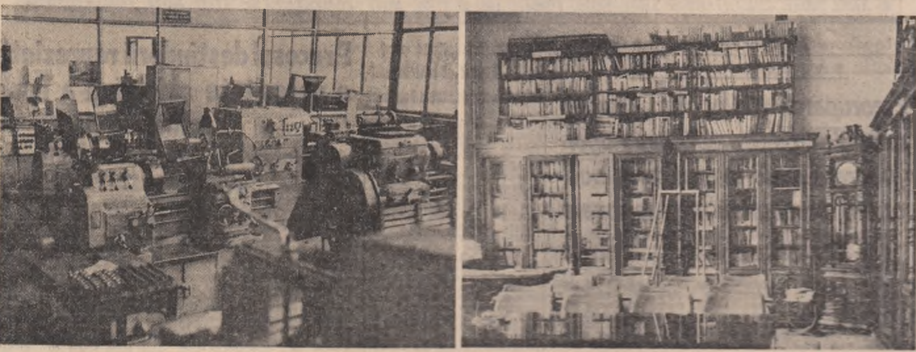
Atelierul catedrei T.C.M. își așteaptă muncitorii — studenții facultății De mine, elevii Liceului „Nicolae Bălcescu” vor imprima și primele cărți