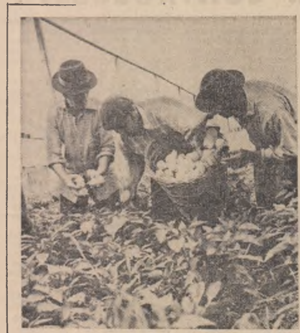
Doou situații opuse, două exemple care demonstrează clar consecințele nerespectării acestui deziderat

● În județele Hunedoara, Alba, Cluj, livrarea neritică și peste capacitatea maximă de producție a Fabricii de zahăr Luduș face ca piñă la intrarea în procesul de fabricație cantități importante de sfeclă să se deprecieze.