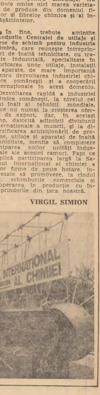
Salonul Internațional de Chimie

tractibile pentru ambalaje. Nu trebuie omise nici marea varietate de produse din domeniul fierului și aliajelor chimice și al îngrășămintelor. ● În fine, trebuie amintite standurile Centrului unificat plesse de schimb pentru industria chimică, care reunește întreprinderi de înaltă tehnologie cu tradiție industrială, specializate în fabricarea unor utilaje, instalații și aparate, de mare importanță pentru dezvoltarea industriei chimice românești și a cooperării internaționale în acest domeniu. Dezvoltarea rapidă a industriei chimice românești la nivelul cel mai înalt ai tehnicii mondiale, duce nu numai la creșterea ofertei de export, dar, în același timp, datorită acțiunii diviziei internaționale a muncii, și la diversificarea achizițiilor de produse avansate, menite să completeze echiparea noilor unități industriale ale acestui ramuri. Fapt ce explică participarea largă la Salonul Internațional al chimiei a unor firme de peste hotare, interesate să promoveze, la rîndul lor, schimburile comerciale și cooperarea în producție cu întreprinderile din țara noastră. VIRGIL SIMION