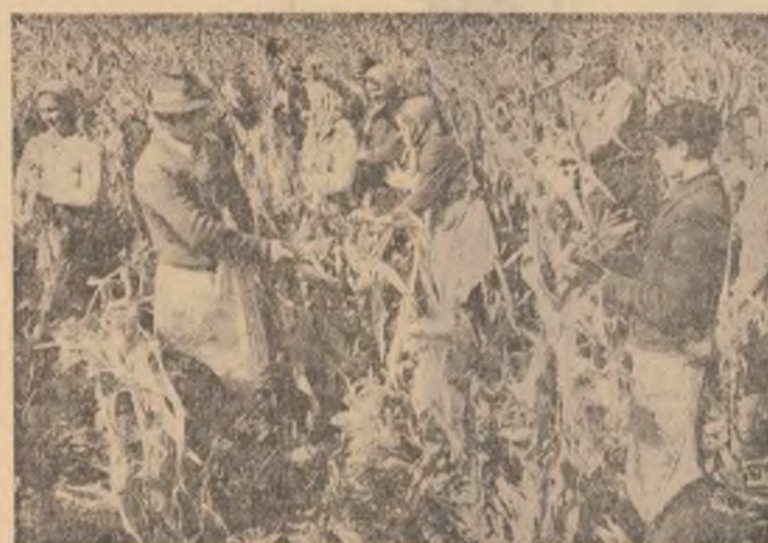
În lanurile de porumb de la Glodeanu — Surz, județul Buzău, recoltă bună, oameni harnici.