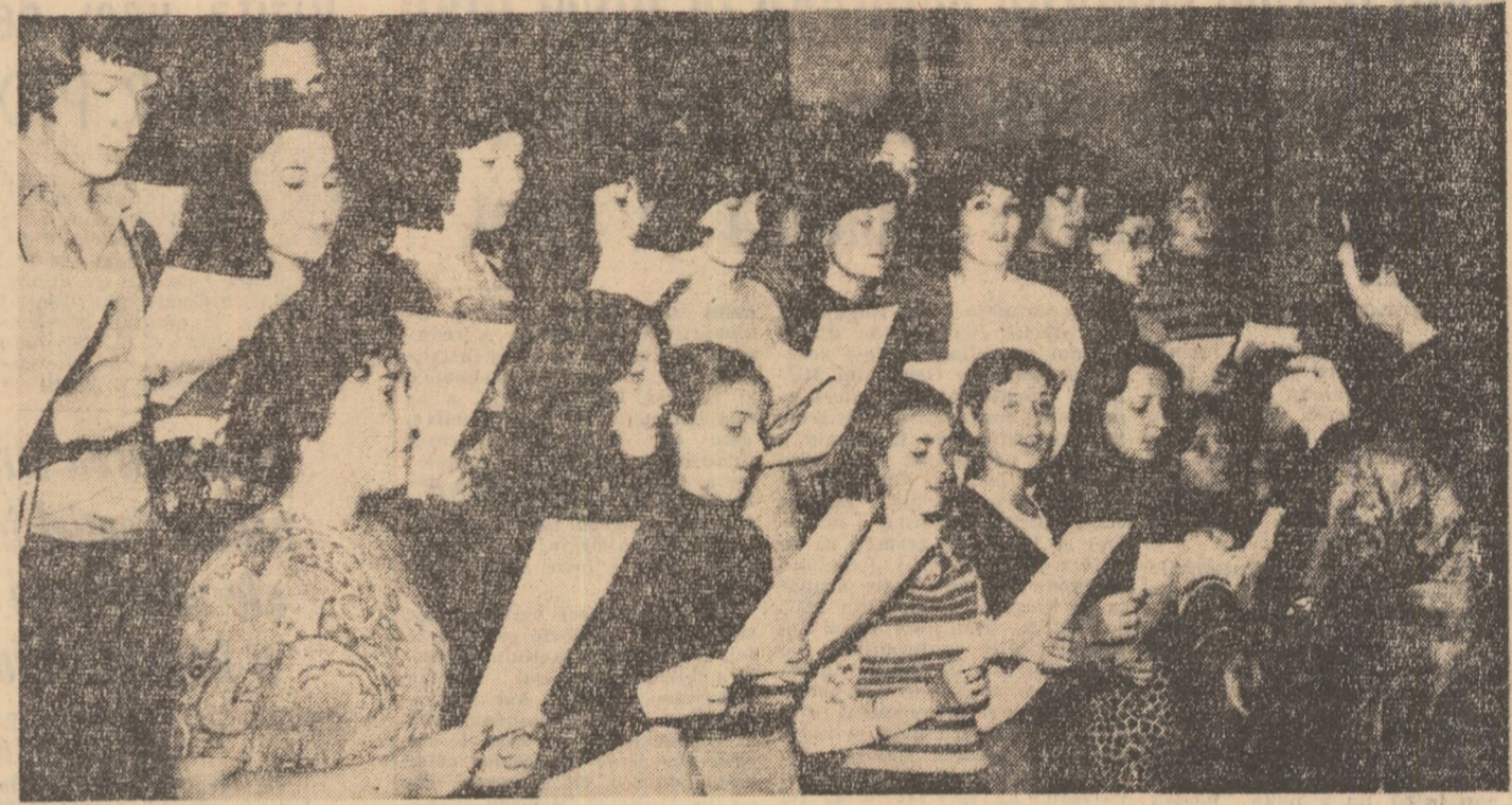
La Clubul T4 din Capitala se cîntă noul Imn