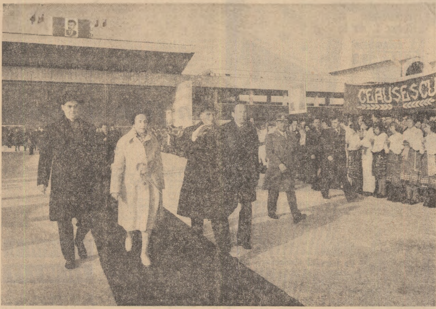
tați ai vieții noastre științifice, culturale și artistice.