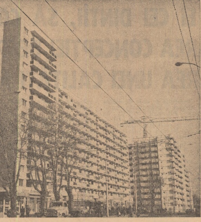
Peisaj obișnuit în cartierul Tei

Este de la sine înțeles că dezvoltarea economico-socială în ritm înalt a țării impune și ridicarea nivelului general de pregătire a fiecărui lucrător indiferent de locul pe care îl ocupă în diviziunea socială a muncii, omogenizarea recoltării în toate domeniile de activitate. În această ambianță, învățămîntul capătă rolul principal în pregătirea forței de muncă de înaltă calificare, capabilă să răspundă exigențelor actualului cincinal, să recepteze cu eficiență și operativitate cerințele progresului