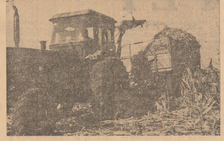
În numărul de azi: