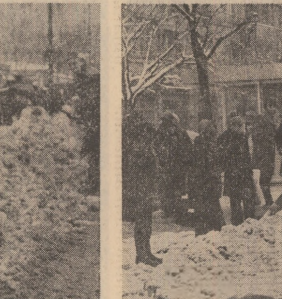
Căderile masive de zăpadă din ultimele zile au impus luarea măsurilor corespunzătoare pentru desăfușurarea în bune condiții a activității în întreprinderile economice, instituții, școli etc. Pentru descongestionarea arterelor principale de circulație, a troturelor, curățarea străzilor și șoselelor pe care circulă vehiculele de transport în comun au fost mobilizate importante forțe mecanice și umane.