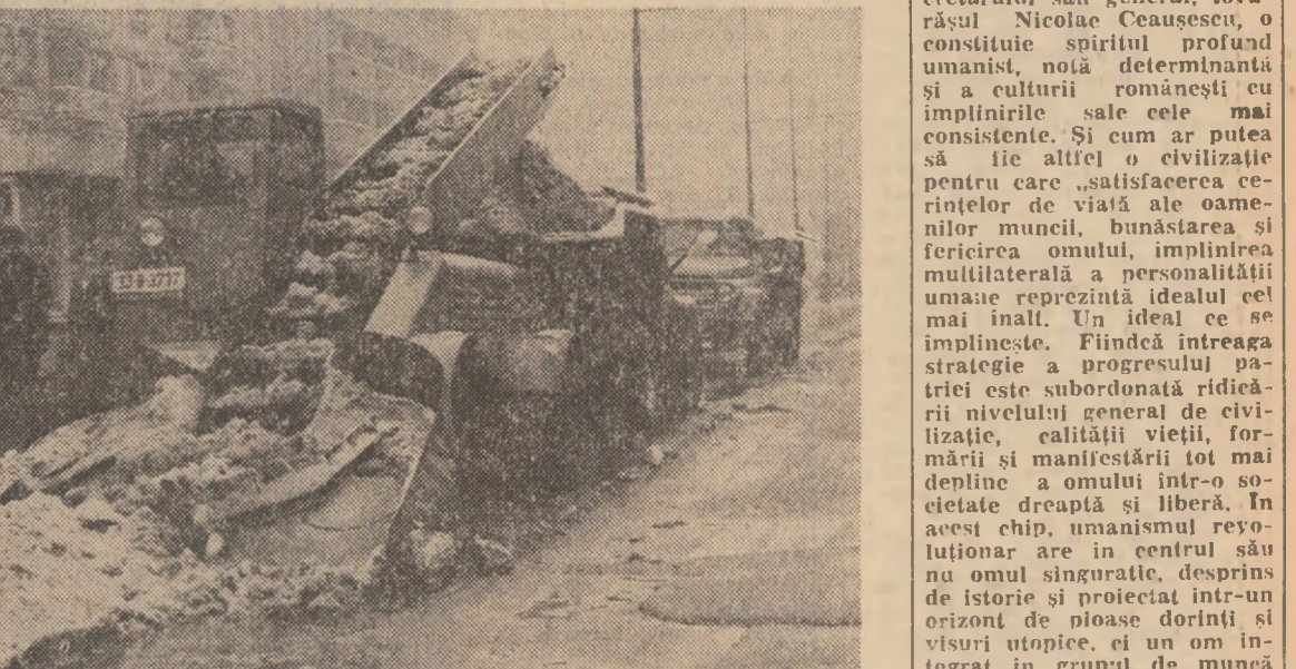
Căderile masive de zăpadă din ultimele zile au impus luarea măsurilor corespunzătoare pentru desăfușurarea în bune condiții a activității în întreprinderile economice, instituții, școli etc. Pentru descongestionarea arterelor principale de circulație, a troturelor, curățarea străzilor și șoselelor pe care circulă vehiculele de transport în comun au fost mobilizate importante forțe mecanice și umane.

IN PAG. A 2-A: relații din București și Brașov