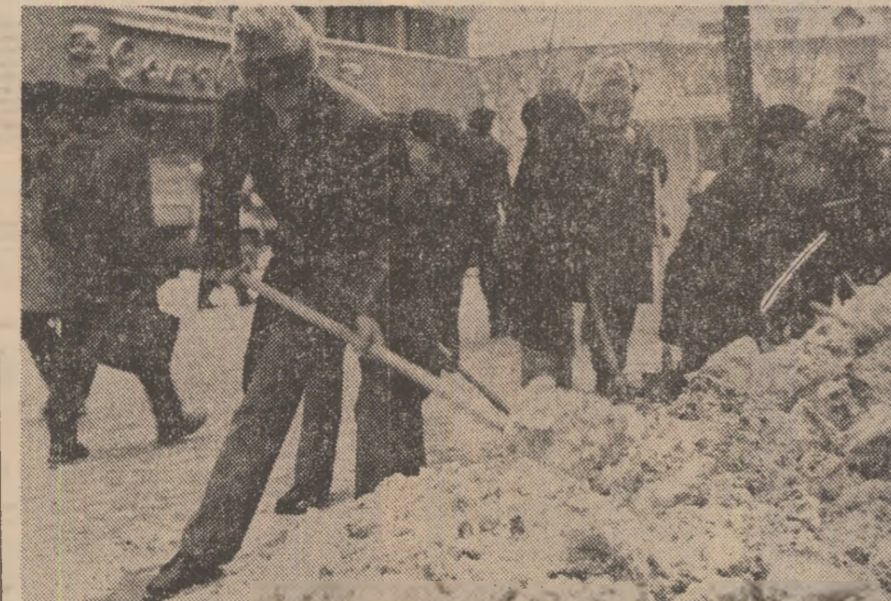
Căderile masive de zăpadă din ultimele zile au impus luarea măsurilor corespunzătoare pentru desăfușurarea în bune condiții a activității în întreprinderile economice, instituții, școli etc. Pentru descongestionarea arterelor principale de circulație, a troturelor, curățarea străzilor și șoselelor pe care circulă vehiculele de transport în comun au fost mobilizate importante forțe mecanice și umane.