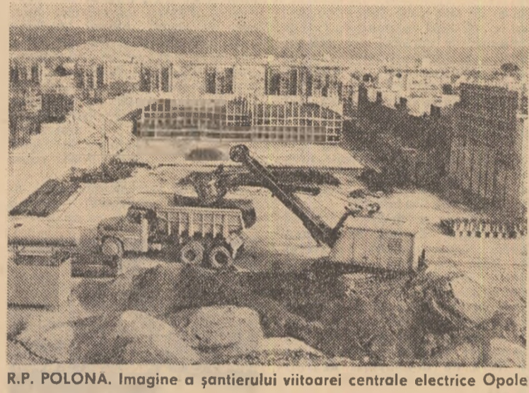
R.P. POLONA. Imagine a șantierului viitoarei centrale electrice Opole

ȘTIRI, NOTE, COMENTARII • ȘTIRI, NOTE, COMENTARII • ȘTIRI, NOTE, COMENTARII • ȘTIRI, NOTE, COMENTARII