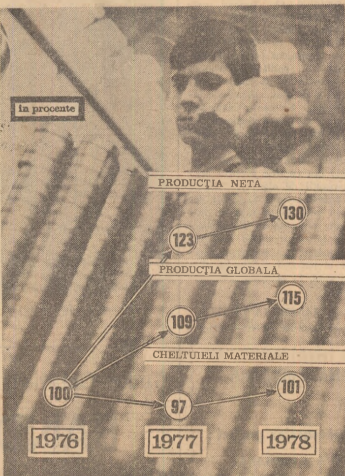
DINAMICA INDICATORILOR PRODUCȚIEI GLOBALE, CHELTUIELI MATERIALE, PRODUCȚIE NETĂ, LA ÎNTEPRINDEREA „RULMENTUL” BRAȘOV