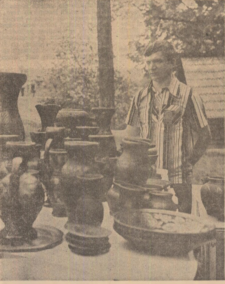
Expoziție de ceramică cu vase, prilejuită de recentul tirg național „Cocoșul de Hurez”