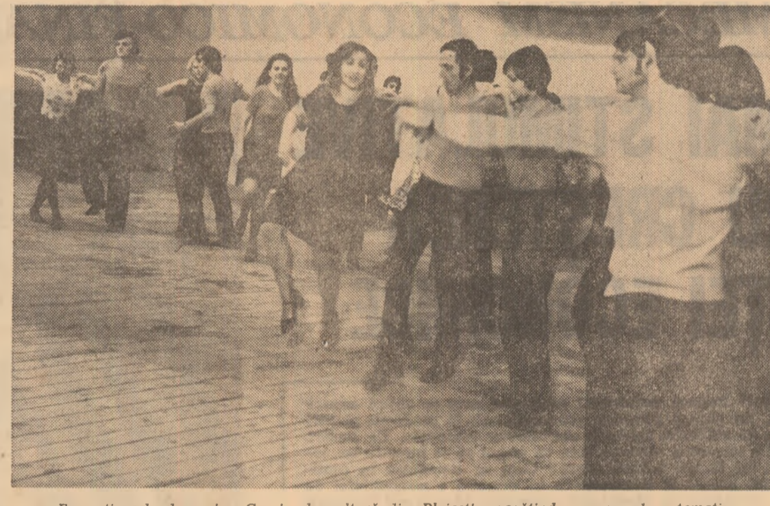
Formația de dansuri a Casei de cultură din Ploiești, pregătind un nou dans tematic