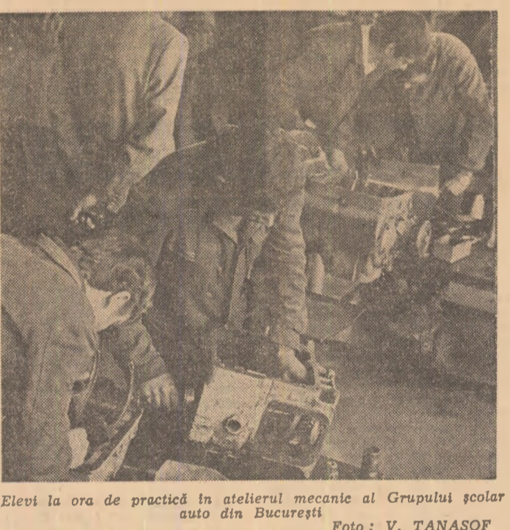
Elevii la ora de practică în atelierul mecanic al Grupului școlar auto din București.

raț părăsea atelierul central AMC. Ca întotdeauna, angajamentul tinerilor de aici fusese respectat. S-a muncit cîte 12 ore în sir sau chiar mai mult, au fost invinse dificultăți ce păreau de netrecut, s-au cîntărit noi prieteni. A fost încă o victorie a acestor tineri în lupta cu timpul, cu ei înșiși. LAURENȚIU OLAN