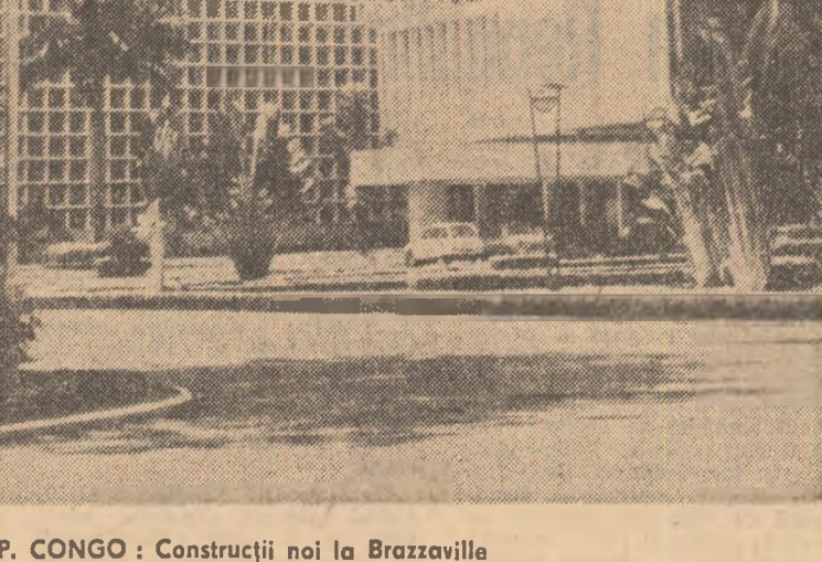
R. P. CONGO: Construcții noi la Brazzaville