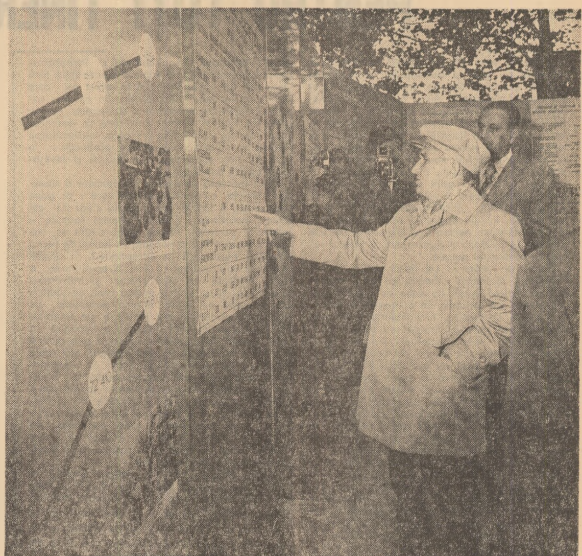
LA STAȚIUNEA DE CERCETĂRI ȘI PRODUCȚIE POMICOLĂ

...Decolind de la Oțelul Rosu, elicopterul prezidențial aterizează, după puține minute de zbor, pe stadionul din Reșița.