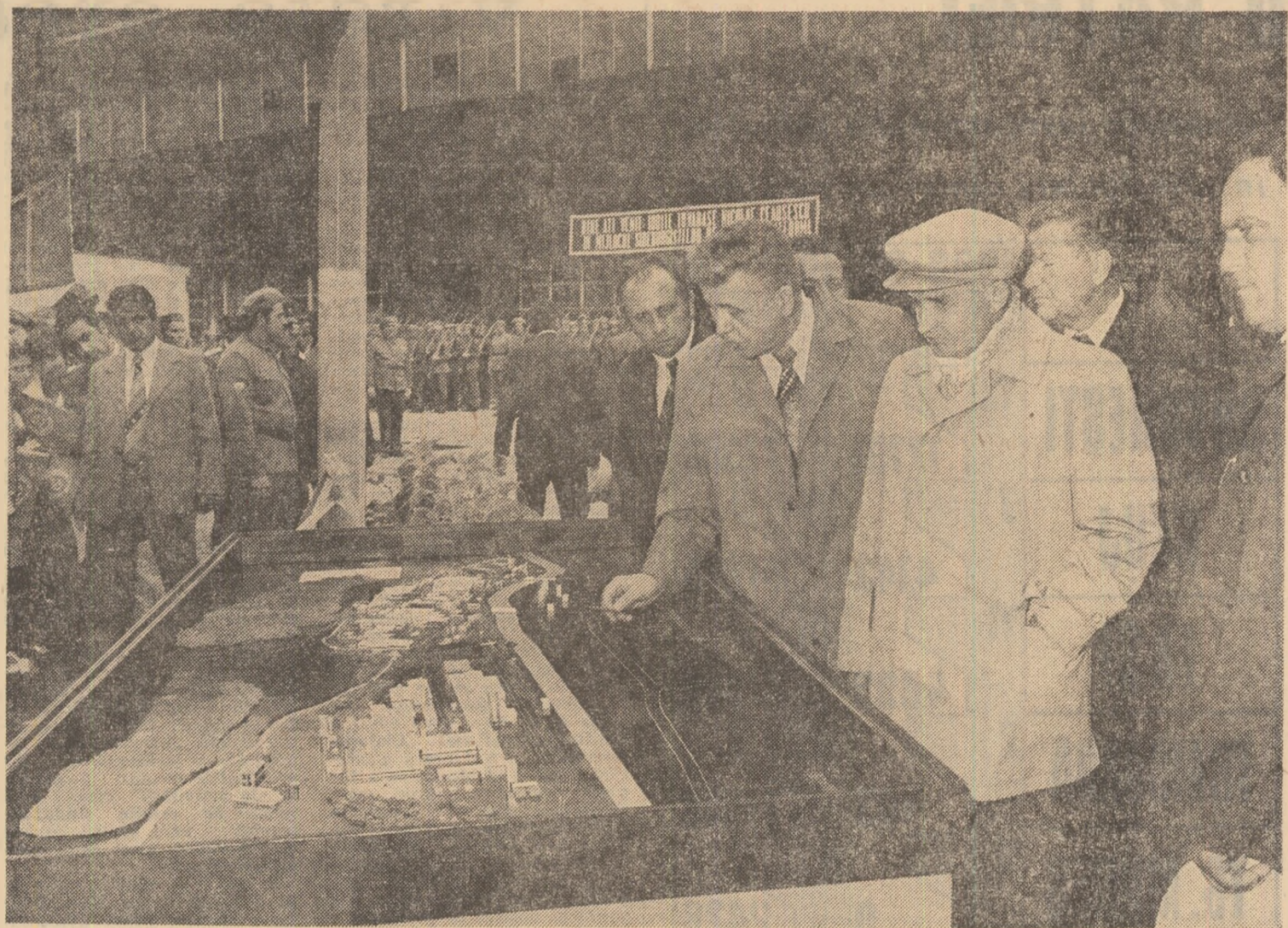
LA ÎNTRINDEREA SIDERURGICĂ „OȚELUL ROȘU”

...Decolind de la Oțelul Rosu, elicopterul prezidențial aterizează, după puține minute de zbor, pe stadionul din Reșița.