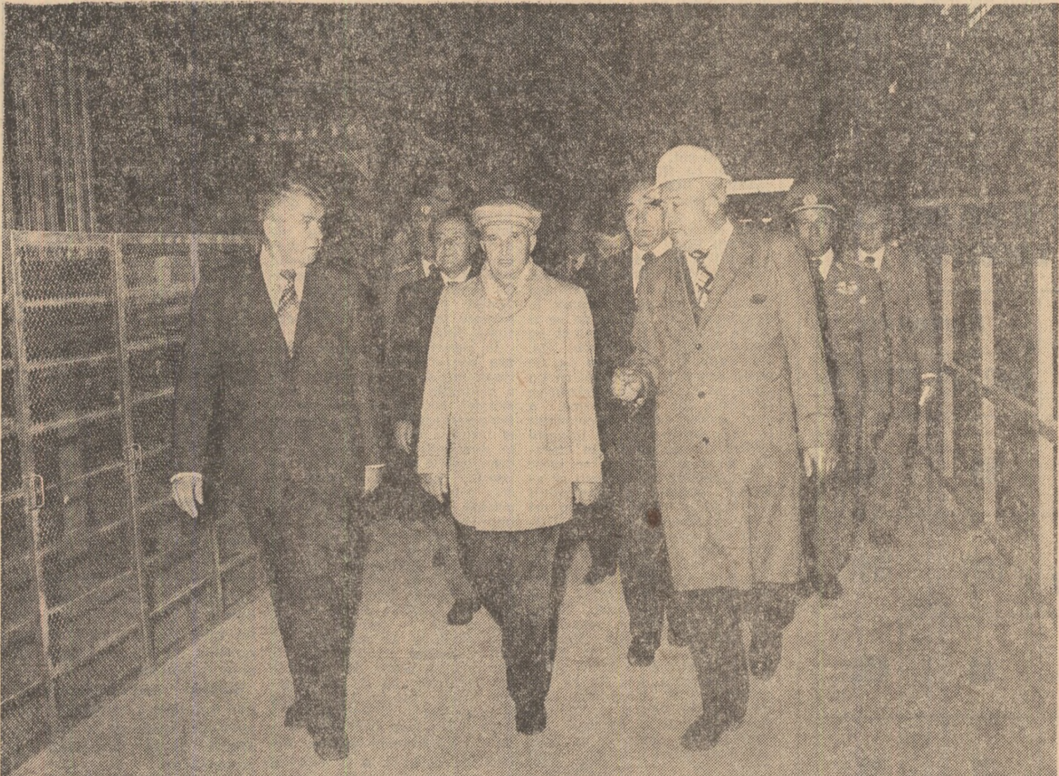
LA COMBINATUL SIDERURGIC REȘIȚA

Ceaușescu este salutată de ministrul industriei metalurgice, Nicolai Agachi, de directorul general al Centralei siderurgice Reșița, Constantin Savu, de specialiștii și muncitorii. Dialogul de lucru se desfășoară