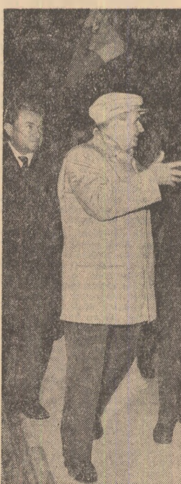
LA ÎNTEPRINDERE DE CONSTRUCȚII DE MAȘINI CARANSEBES

În județul Caraș-Severin, importantă zonă industrială, va trăi milenară a neamului nostru, tovarășul Nicolae Ceaușescu analizează cu sârmă și cu siderurgistii, constructorii de mașini, cu lucrătorii din agricultura județului, cu reprezentanții ai organelor locale de partid și de stat, ai ministerelor economice, stadiul îndeplinirii obiectivelor puse în fața acestui detasament de nădejde al clasei noastre muncitoare, a tuturor celor ce muncesc și trăiesc pe străbunele meleaguri ale Carasului, de hotărârile Congresului al XI-lea și Conferinței Naționale ale partidului, modul în care se acționează pentru transformarea cantității într-o nouă calitate, superioară. În același timp, pornind de la importanța rezerve materiale și umane existente, se jalonează noi perspective pentru dezvoltarea viitoare a acestui județ, care își aduce o contribuție esențială la creșterea în ritm rapid a economiei naționale.