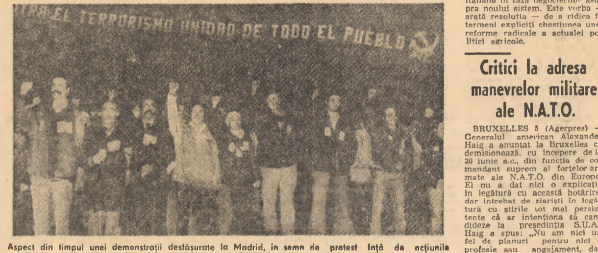
Aspect din timpul unei demonstrații desfășurate la Madrid, în semn de protest față de acțiunile teroriste ce au avut loc în Spania în ultimele zile

● LA BELGRAD a început o reuniune de consultări politice dintre reprezentanții Secretariatului federal iugoslav pentru afaceri externe și ai Foreign Office-ului din Marea Britanie. Agenda convorbirilor cuprinde o schimb de opinii cu privire la situația internațională actuală în sfera relațiilor dintre Europa, aspecte ale destinderii, activități legate de continuarea Conferinței pentru securitate și cooperare în Europa, probleme ale ordinii economice internațional, relații cu țările din Europa și Marea Britanie și cu Piața comună. IN PERSPECTIVA ALEGERILOR GENERALE DIN ANGLIA Partidul laborist, de guvernămînt, din Marea Britanie, a intrat în cu 3 la sută mai multe suflete decât Partidul Conservator în cadrul primului sondaj efectuat anul acesta, an în care, prin 1 luna octombrie, premierul James Callaghan trebuie să organizeze alegerile generale. Potrivit sondajului efectuat de ziarul conservator „Daily Mail”, 47,9 la sută dintre persoanele chestionate au declarat că vor vota pentru laboriști, 44,7 la sută pentru conservatori, 4,6 la sută pentru liberali, iar 2,8 la sută pentru alte partide. Aceste date relevă, în aprecierea agenției Reuter, că alegerile generale vor prileji una dintre cele mai strînse lupte între laboriști și conservatori. ● GUVERNUL AFGANISTANULUI a anunțat începerea lucrărilor la o serie de noi proiecte în sectorul industrial și al serviciilor publice.