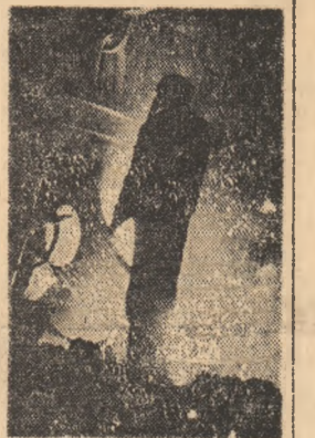
SUPLIMENTAR, IMPORTANTE CALITĂȚI DE PRODUSE CHIMICE

Oamenii muncii din întreprinderile industriale ale Capitalei, cel mai puternic centru economic al țării, au pîșit în 1979 cu hotărîrea fermă de a îndeplini în mod exemplar sarcinile mult sporite inscrite în planul celui de-al patrulea an al actualului cincinal. O premisă hotărîtoare pentru realizarea noulor prevederi a constituit-o rezultatele obținute în cursul anului de curînd încheiat, cînd s-a înregistrat un spor la producția industrială în valoare de peste 2,4 miliarde lei. Au fost îndeplinite, de asemenea, sarcinile la producția marfă și la export. La baza acestor succese a stat, în principal, ocuparea pentru creșterea continuă a productivității muncii, indicator ale cărui prevederi au fost depășite cu 1,8 la sută.