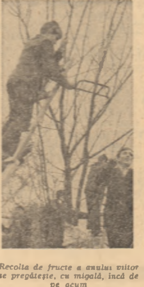
Recolta de fructe a anului viitor se pregătește, cu migală, încă de pe acum

La Mănești, în județul Dâmbovița, în plantația de mere cooperatizată, la sfîrșitul sezonului a început sărbătorirea „Zilei de activitate neîntreruptă în agricultură”. O experiență care se recomandă.