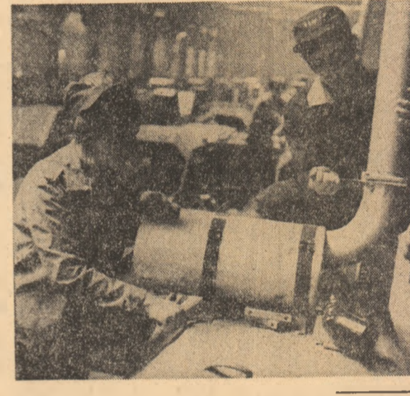
Locuri care se cheamă Unirea

și utilizez. Trebuie să fie inventiv, prompt, curajos, corect, foarte bine pregătit profesional. Laborant. Cunoaște natura întinmă a tuturor corpurilor și substanțelor chimice. Calități: spirit de observație, putere de concentrare, îndemnare. Astea-să dîntre cele mai noi.