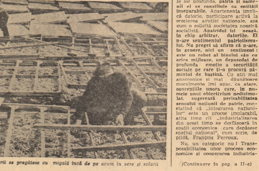
Recoltele mari de legume timpurii se pregătesc cu migală încă de pe acum în sere și solarii

Mărturisesc, din capul locului, că ori de cîte ori mă aplec cu condeiul asupra hîrtiei pentru a scrie despre patriotism sînt o vibrație intensă care mă face să consider că niciodată geometria colii albe nu poate cuprinde bogăția de determinări a acestui cuvînt. Cuvînt a cărui încălțătură de senouri și semnificații este atît de vastă și de complexă, încît orice dezbateră în jurul său trebuie să facă apel, în mod necesar, la toate dimensiunile proprii noastre ființe. Pentru că patriotismul desemnează, mai întîi, o anumită construcție a conștiinței noastre despre lume, despre viață. Patriotismul nu este, cum s-a consacrat, doar un sentiment social, doar un fapt de psihologie colectivă, fie el foarte structurat și foarte durabil. Accentul pe această latură a sa, chiar dacă am admia și o componentă elaborată, anume gladiatori din peisajul istoric al societății și psihologiei, tributari unui viziuni simplificate și unilaterale, n-au existat să-i găsească atribute de „instinct gregar” (H. Laski), de instinct pur și simplu (G. Davy) sau de cult bazat pe recunoștință și dragoste (A. de Larnadelle). Pe această linie, unii analiști mai noi subliniază faptul instințial al patriotismului pentru a acredita ideea că, prin opoziție cu acesta, s-ar constitui