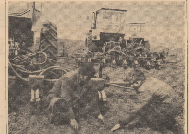
C.A.P. Spantov: un ultim control înaintea încheierii însămînțării pe întreaga suprafață destinată speciei de zahăr

Primăvara, cu multitudinea lucrărilor specifice campaniei de însămînțări, impune pe ogoare o riguroasă ordine și disciplină în desfășurarea activităților complexe, înaltă responsabilitate față de calitatea muncii. Respectarea perioadelor optime din punct de vedere tehnologic asigură nu numai o rîmicitate și o îndeplinire a graficelor la semănat dar, în perspectiva unui an agricol, garantează realizarea recoltelor planificate în raport de potențialul existent. Experiența unităților frumuse, ca argument, demonstrează importanța urmării permanente a vitezelor zilnice de însămînțare, în vederea încadrării în timpul optim. Cum se acționează, prin prisma acestor cerințe, în unitățile agricole care au declarat din plin campania de însămînțări? RAIDUL NOSTRU, DIN PAGINA A III-A, a surprins în acest sens câteva aspecte semnificative din județul Ilfov.