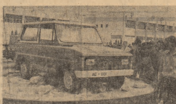
ARO 10 — cel mai nou produs al întreprinderii din Cimpulung, prin performanțele sale îi va prinde din urmă pe frații mai mari care alărgesc pe șosele din numeroase țări ale lumii.

Coordonate de bază ale politicii externe a partidului și statului nostru, colaborarea și cooperarea pe multiple planuri cu toate țările în curs de dezvoltare cunosc, de la an la an, o tot mai mare dezvoltare și aprofundare. Este suficient să amintim ca argument doar faptul că ponderea acestui grup de țări în totalul comerțului nostru exterior s-a ridicat de la 8,2 la sută în 1970, la 21,5 la sută în 1976, urmând să ajungă la circa 25 la sută în 1980. Într-un plan particular, o asemenea dinamică este sesizabilă și în ceea ce privește participarea unor țări în curs de dezvoltare la manifestările economice internaționale pe care le găzduiește în fiecare primăvară capitala României. Și, în acest sens este suficient să arătăm că la actuala ediție sunt prezente, pentru prima dată, patru astfel de țări — Algeria, Chile, Maroc și Sudan — care se amănă a celor, mult mai numeroase, devenite deja participante tradiționale. Dar țigul mai relevă și un alt element, calitativ, care atestă o continuă diversificare și aprofundare a domeniilor și formelor de colaborare economică, ca urmare a posibilităților mereu crescânde ale economiei românești, a confirmării pe care viza a dat-o principiilor și căilor promovate de țara noastră în relațiile economice cu aceste state.