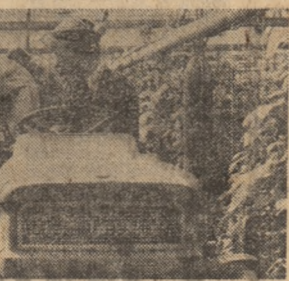
De la sera tineretului din comuna Izvoare, județul Neamț, pleacă noi cantități de tomate