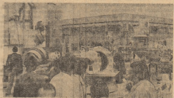
Utilajele chimice încorporate în complexe instalații constituie una dintre cele mai reprezentative oferte de export românești pentru numeroase țări în curs de dezvoltare.