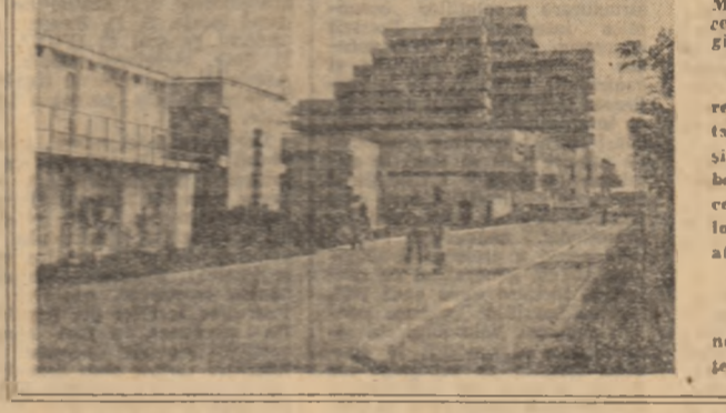
Planșă mică a Palatului Republicii, în liniștea penumbră...

● Pentru orice vîrstă o scurtă vacanță de primăvară.