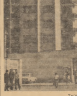
Zălau — 1979