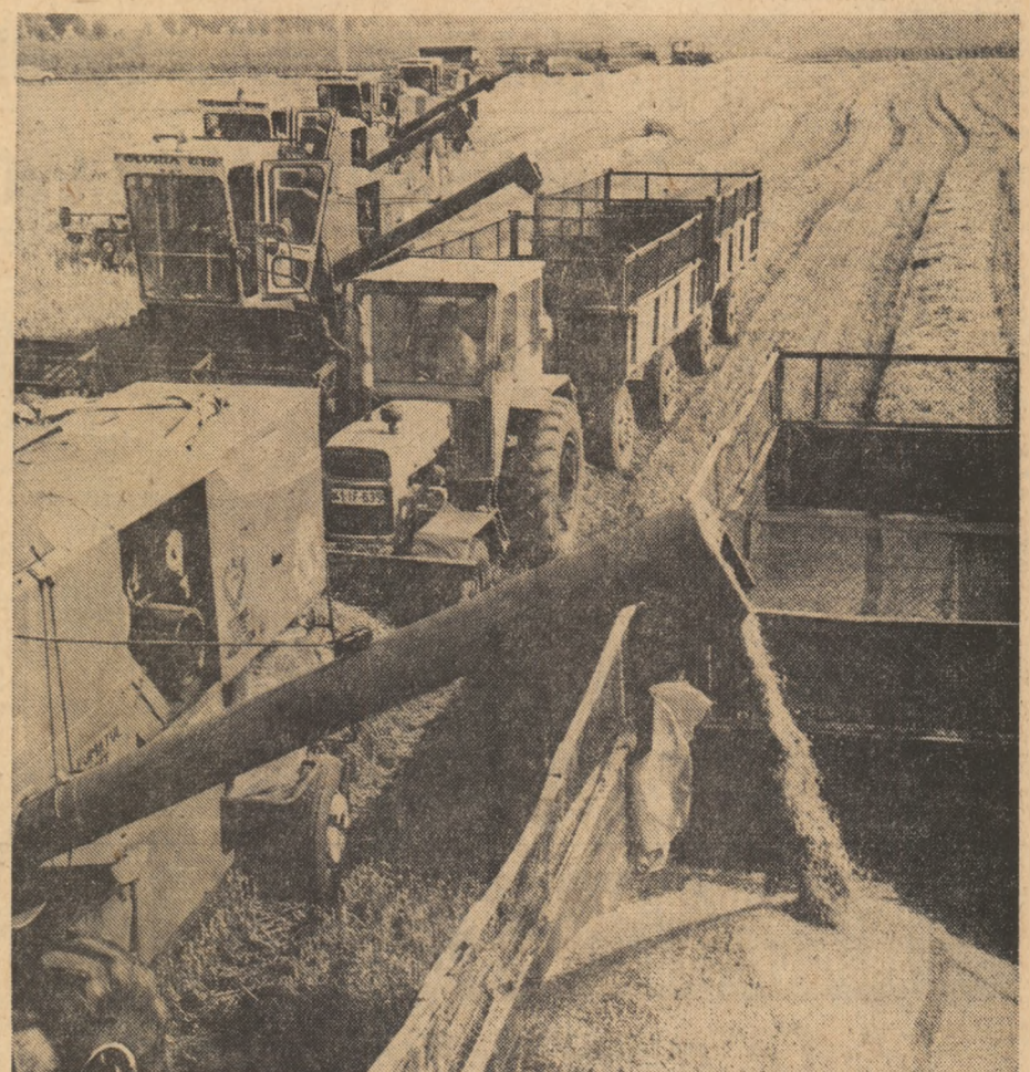
Rezultate bune obținute în campania orzului un îndemn la muncă susținută în ampla acțiune declanșată în aceste zile

Tovarășul Nicolae Ceaușescu, secretar general al Partidului Comunist Român, președintele Republicii Socialiste România, a primit, miercuri, în stațiunea Neptun, pe V. I. Drozdenko, ambasadorul Uniunii Sovietice la București, la cererea acestuia.