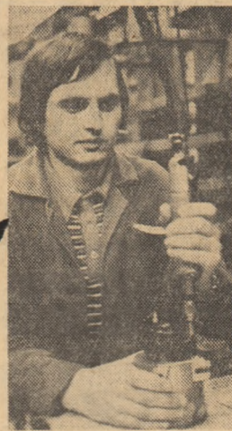
Uteciștii I.A.E.A.M.E. — Sf. Gheorghe, este un exemplu în muncă și viața de organizare.

PESTE 40 DE UNITĂȚI din industria județului Timiș, Arad și Caraș-Severin au anunțat îndeplinirea înaintea termenului a producției planificate pe primul semestru al anului. Printre acestea se numără exploatarea carboniferă Anina, întreprinderea metalurgică „Clocanul” din localitatea Nădrag, întreprinderea de materiale de construcții din Timișoara, Jimbolia și Lugoj, întreprinderile electrotehnice „Electromotor”, „Electrotim”, „Electrobanat”, „Electrometal” și cea de aparate electrice de măsurat, fabrica de memorii electronice Timișoara. Aceste unități vor lăsa în plus economiei naționale, pînă la sfîrșitul lunii importante cantități de cărbune, laminat, tablă zincată, prefabricate din beton și alte produse, în valoare de aproape 200 milioane lei.