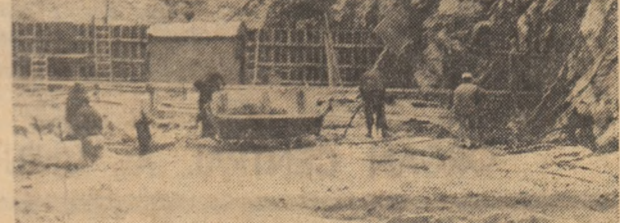
Se pregătește turnarea unei noi lamele de fundație la Barajul Dragan, județul Cluj