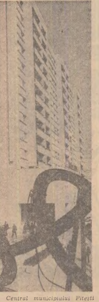
Central municipiului Pitești