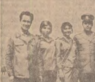
Plome cucerite la astfel de întreceri, republican sau județene...