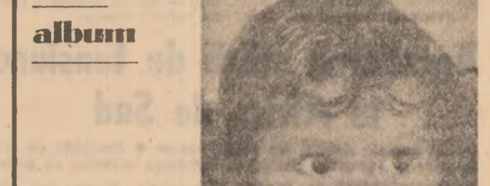
„Mugur alb și roz și pur”