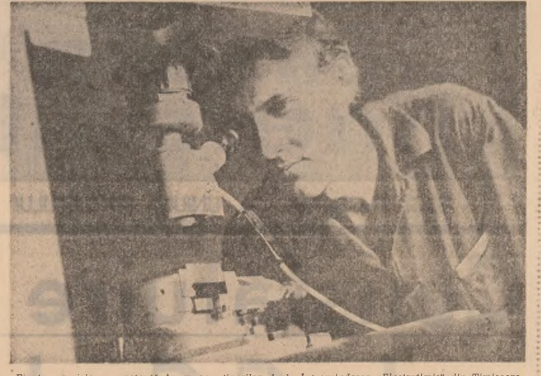
Finețe, precizie, competență în munca tinerilor de la Intreprinderea „Electrotimis” din Timișoara.