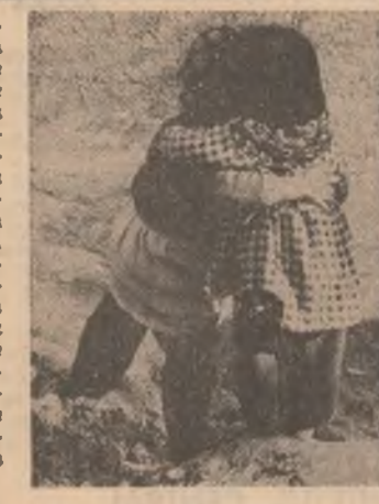
Este oare rațional?

Se vorbește mult, ne preocupăm mult, „societatea de mine”, lumea în care vor crește copiii noștri și copiii copiilor noștri. Ce le rezervă aceasta? Vacanțe pe lună? O atmosferă pozitivă? O planetă incapabilă să-