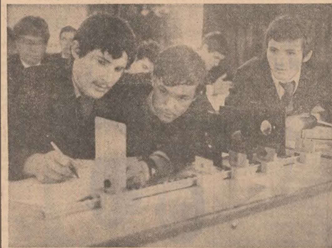
În laboratorul de fizică a Liceului industrial mecanic-auto din București

Întreprinderea „Electroputere” din Craiova a asilmitat în fabricație 20 tipuri noi de motoare și 3 tipuri de transformatoare electrice cu puteri cuprinse între 2 000 și 50 000 kVA pentru metalurgie. Concepție de specializată a Centrului local de cercetare științifică și inginerie tehnologică, noile produse se caracterizează prin parametri tehnico-economici similari celor procurate pînă acum din import, ceea ce permite ca la nivelul acestui an efortul financiar al țării să se reducă cu circa 120 milioane lei valută.