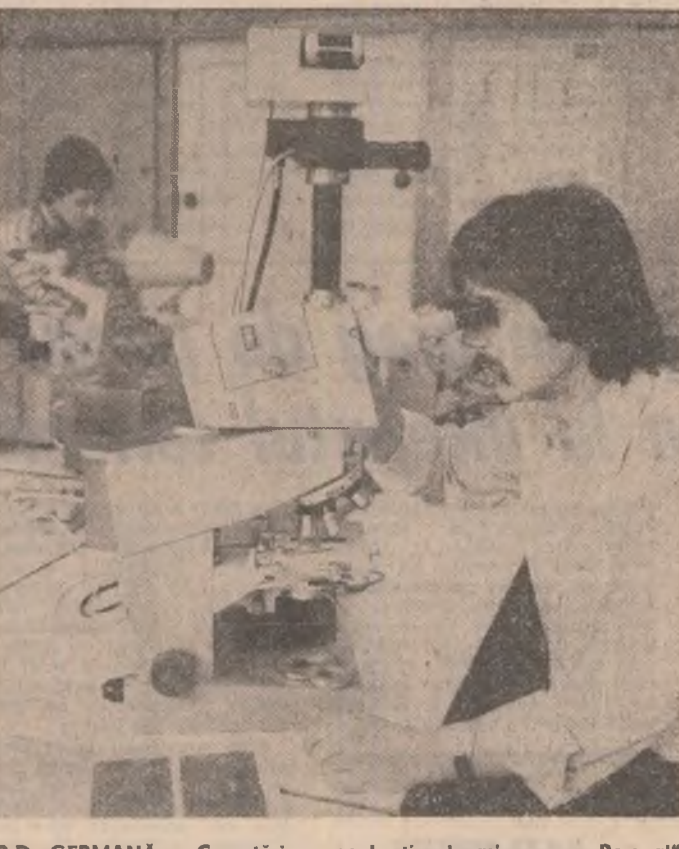
R.D. GERMANĂ : Cercetări cu noul tip de microscop "Peraval", produs al cunoscutei firme "Carl Zeiss" din orașul Jena