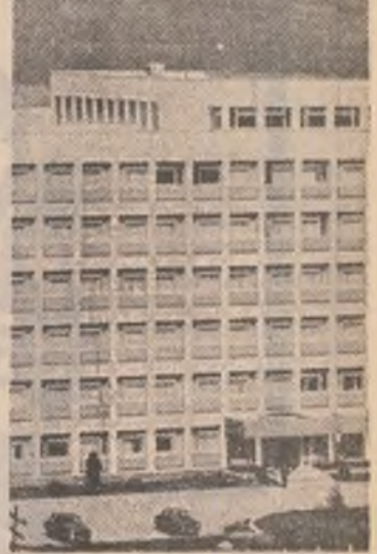
Arhitectura modernă predomină în construcțiile din întreaga țară

Șansa tineretii, rubrica pe care o inaugurăm azi se vrea un coloziv despre tinerete, adică despre frumusețea și pasiunea, despre dragoste și muncă despre șansa de a fi tiner într-o țară a spiritului tinăr.