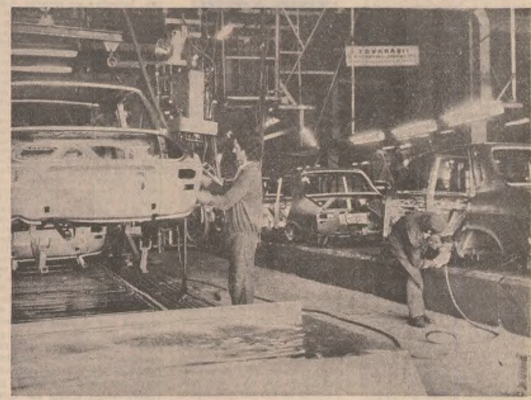
Pe banda de montaj a întreprinderii de autoturisme Pitești — locul unde prind conturul definitiv modelele limuzine „Dacia 1300”