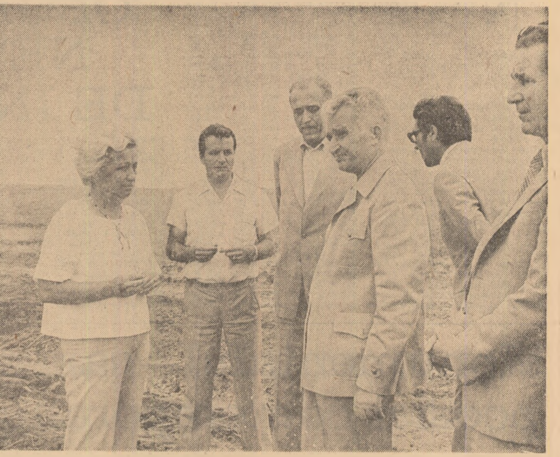
P.C.R., Ion Stoian, în numele comunistilor, al întregii populații a județului, a mulțimii tovarășului Nicolae Ceaușescu pentru vizita de lucru efectuată, pentru indicțiile și recomandările făcute cu acest prilej, asigurîndu-l că organele de partid și de stat locale, toți o-

menții muncii din județul Constanța vor acționa cu toată fermă pentru îndeplinirea lor. La plecare, secretarul general al partidului, președintele Republicii, este înconjurat din nou cu dragoste de mii de cetățeni care aplaudă cu însuflețire, scandează „Ceaușescu-P.C.R.!”