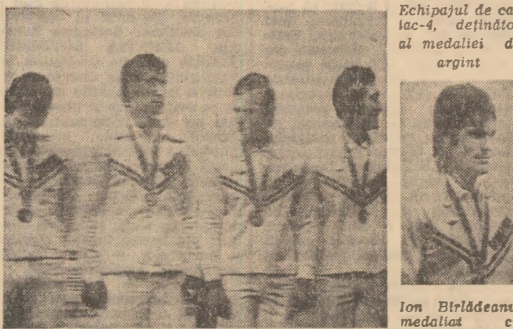
Fehipajul de calac-4, deținător al medaliei de argint