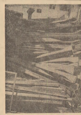
Potrivit unui apel la economie, o reducere cu 1 la sută a consumului de lemn echivalează cu o economie de 30 pe an. Efectul 1 lemn de bună calitate, asomus „strategic” între două blocuri

Produse tot mai căutate datorită rezistenței mult superioare celor din lemn, cofrajele metalice sînt din ce în ce mai solicitate. Numai că durata de funcționare e tot mai îndelungată deplina de modul cum sînt îngrijite (curățate și unse) după întrebunare. Or, imaginele de față contrazic ceea ce ar trebui să se facă în mod curent