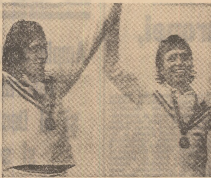
Cuplul de aur Ivan Patzaihin și Toma Simionov