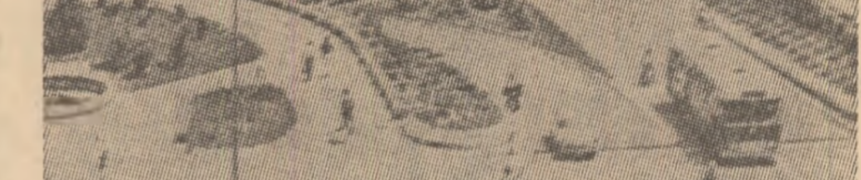
R.S.F. IUGOSLAVIA — Construcții noi, moderne în frumosul oraș Skopje

ANKARA 4 (Agerpres). — După cum transmit agențiile internaționale de presă, acțiunile teroriste s-au intensificat considerabil în Turcia în ultimele zile, în proceda în stare permanentă de alertă pentru a preveni apariția de noi incidente. Luni, un comunicat al poliției informa că în cele două zile precedente, ca urmare a actelor de violență dintr-un grup de 17 persoane, dintr-un grup de patru în orașul Adana, Agenția Associated Press menționează că luni poliția a descoperit trupurile și trei muncitori, ucisi cu arme automate în localitatea Kayseri.