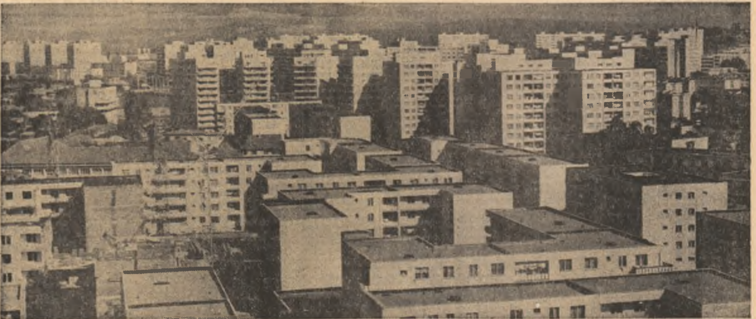
Piatra Neamț — cartierul Dărmănești