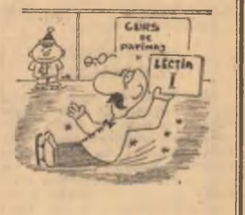
Desen de MATEI MIHAI

Pentru tinerii covîneni doniciu să practice schiul și săniiul, s-au amenajat în această iarnă mai multe pîrtii. Cele mai solicitate sint cea de pe Dealul partizanilor, din Sf. Gheorghe și cea de la Cernăuți. De fapt, aici, în aceste localități, s-au organizat recent tabere de schi respectiv la Liceul de construcții și școala generală. Tot acum se precălesc și primele concursuri.