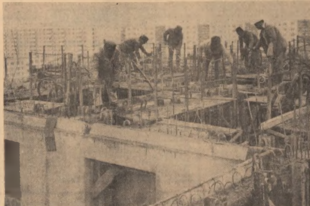
Pe șantierele viitorului ansamblu de locuințe din Bercești, noul an de activitate a debutat sub semnul noii calități și al unei exigențe superioare în întreaga activitate.

pus în funcțiune mașinile, instalațiile și a început să se execute noile produse, ci practic, în marea majoritate a locurilor s-au reluat lucrările la obiectivele atase încă din anul trecut, a continuat să se ridice un nou nivel la un loc sau la o școală, în lăsa impresia unei continuități firești, a unei treceri normale dintr-un an în celălalt. Și totuși nu este așa. Am descoperit multe schimbări, mai ales de ordin calitativ după ce am străbătut, la aceste prime ceasuri, ale anului 1981, câteva din noile cartiere ale Capitalei, câteva din șantierele viitoarelor mari artere ale municipiului după ce am aflat de la numeroși tineri constructori care sînt sarcinile pe care le au de îndeplinit în 1981, principalele obiective aflate în fața lor în primele luni din acest an.