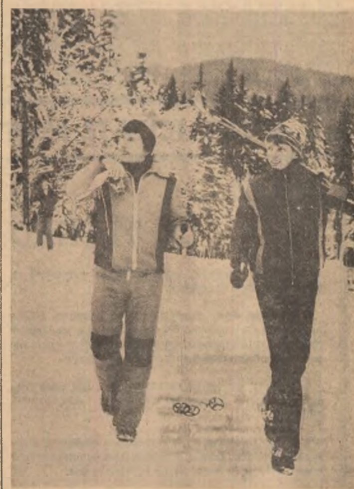
Vacantele, nu uităm vacanșele!

ȘTEFAN DORGOȘ (Continuare în pag. a II-a)