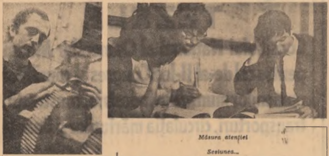
Măsura atenției Sesiunea...