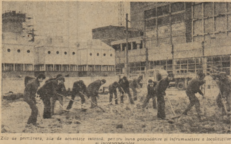
Zile de primăvară, zile de activitate intensă, pentru buna gospodărire și înfrumusețare a localităților și întreprinderilor

ASTĂZI, ÎN JURUL OREI 9, POSTURILE DE RADIO ȘI TELEVIZIUNE VOR TRANSMITE DIRECT, DE LA SALA PALATULUI REPUBLICII, ȘEDINȚA DE DESCHIDERE A CONGRESULUI UNIUNII GENERALE A SINDICATELOR.