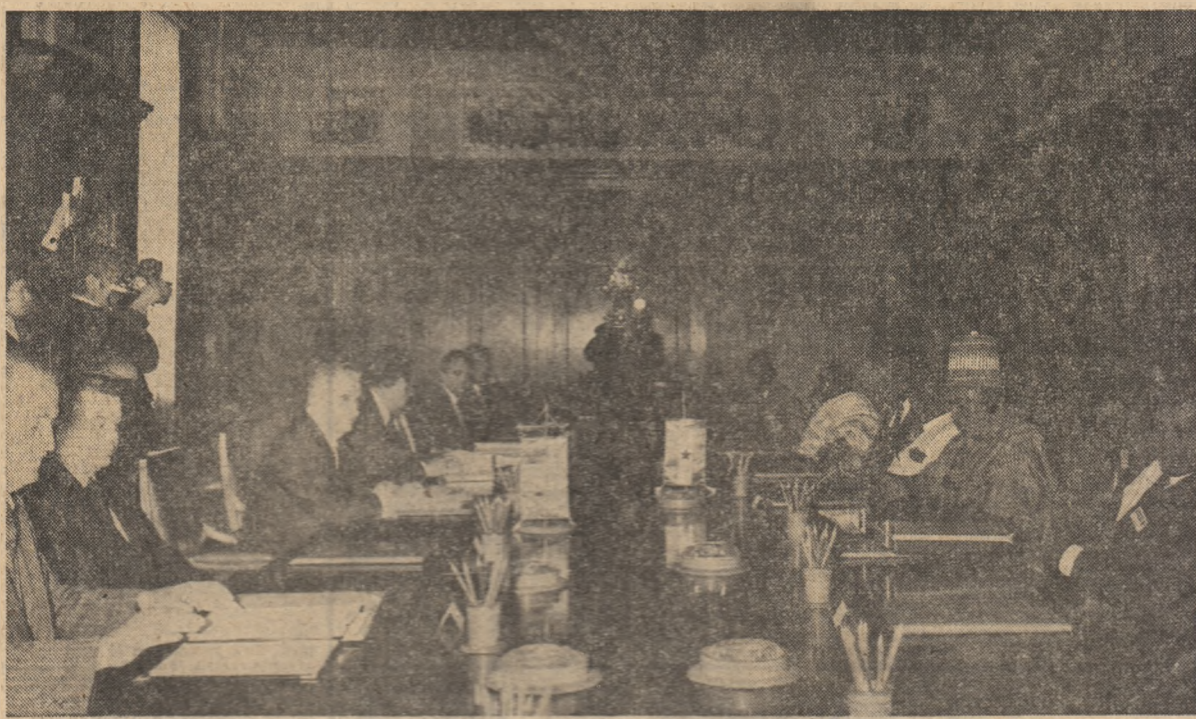
(Continuare în pag. a V-a)

colaborare, independent și pace, pentru așezarea relațiilor internaționale pe baza principiilor egalității în drepturi, respectului independenței și suveranității naționale, neamestecului în treburile interne, nerecurgerii la forță și la amenințarea cu forța. În același timp a fost relevată necesitatea sporirii eforturilor pentru lichidarea stărilor conflictuale existente în diferite regiuni ale globului, pentru ca toate diferendele dintre state să fie reglementate prin mijloace pașnice, prin tratative, renunțându-se la folosirea forței, la înfruntări militare. Analizând situația de pe continentul african, cei doi șefi de stat au exprimat — și de această dată — solidaritatea țărilor lor cu lupta popoarelor Africii împotriva imperialismului, colonialismului, neocolonialismului, a oricăror forme de dominație și asuprire, pentru apărarea și consolidarea independenței naționale, pentru emancipare economică și socială, pentru a dispune de bogățiile naționale, de propria soartă. A fost reafirmată hotărârea României și Ghanei de a sprijini activ lupta poporului din Namibia pentru dobândirea independenței depline, de a milita susținut pentru lichidarea definitivă a politicii de discriminare rasială și apartheid în Africa de Sud. S-a subliniat că problemele