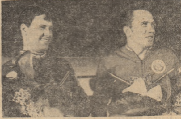
medicilor la care s-a fost supuși cei doi cosmonauți — Dumitru Prunariu și Leonid Popov — se simt foarte bine...