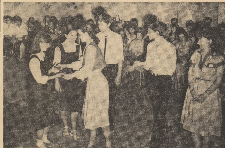
Moment emoționant la Liceul „C.A. Rosetti” din București: „cheia de aur”... succesorul în învățământ și a frumoaselor tradiții școlare