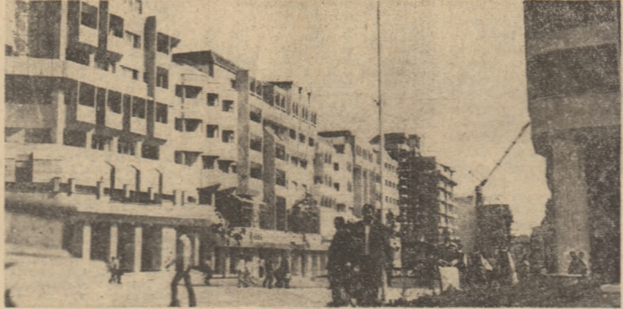
Calea Unirii din Chisinau îmbracă haine noi