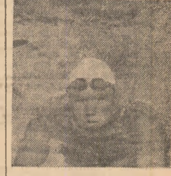
SERGHE FESENKO (U.R.S.S.) natație