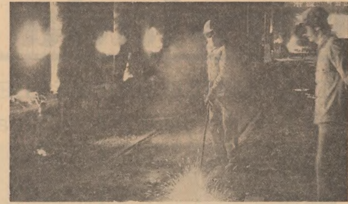
CUBA: Imagine din secția de topitorie a Uzinei „Jose Marti” din Havana