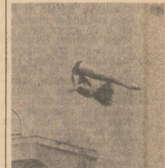
CHEN XIAOXIA (R.P. Chineză) sărituri