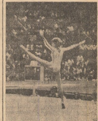
NADIA COMĂNECI (România) gimnastică