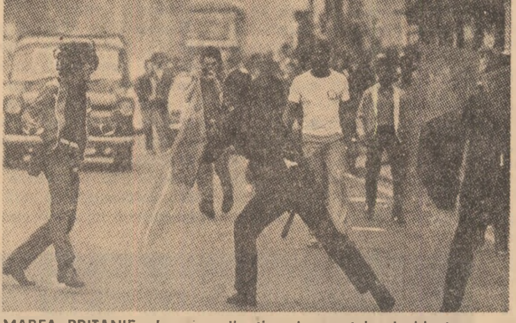
MAREA BRITANIE: Imagine din timpul recențelor incidente ce au avut loc în orașul Liverpool

În urma cutremurului produs marți seara în provincia Kerman, din sud-estul Iranului, de sub dărîmături au fost găsite o mie de morți, numărul răniților fiind de peste 700, a