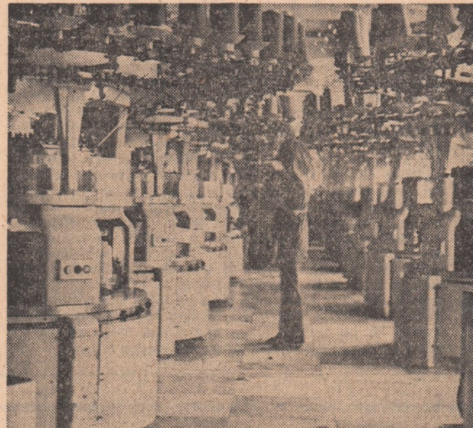
Aici, la întreprinderea „8 Martie” din Piatra Neamț, tinerii muncitori obțin rezultate bune în întrecere datorită unei riguroase discipline și a bunei organizări a locului de muncă

mașini rotative. Să reținem doar ceea ce ni se spune: pînă la ora de față producția fizică anuală nu e realizată decît în proporție de cincizeci la sută (!). După recuperarea unei arii stări de lucruri, argumentul renunțării la producția de serie nu poate acoperi nici pe departe rămășițele în urmă. Se aduce atunci în discuție nerespectarea disciplinelor contractuale din partea unor colaboratori, precum și calitatea slabă a unor materii prime și materiale. Faptele ce ne sînt prezentate îngreunează fără doar și poate procesul producției la motoare rotative. Așa sînt: calitatea deseori slabă a tablei silicioase livrată de combinatul din Tîrgoviște, defecțiile de emalare a sîrmei livrate de I.C.E. București, calitatea discutabilă a unor piese turnate trimise de I.C.M. Reșița etc. Colaboratorii și furnizorii de materii prime și materiale au desigur partea lor de vină. În același timp și trecerea de la producția de serie la cea de unicat sau de produse de serie mică a complicat procesul de fabricație, dar