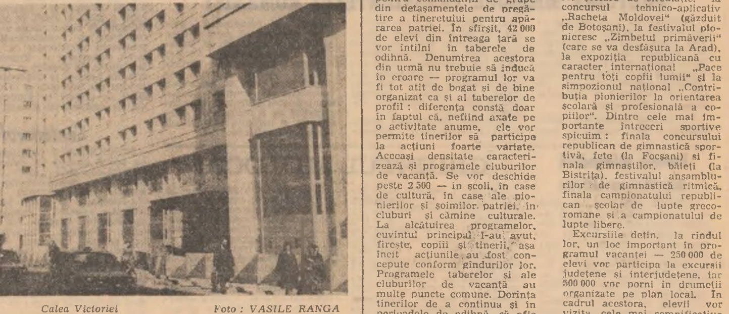
Calea Victoriei