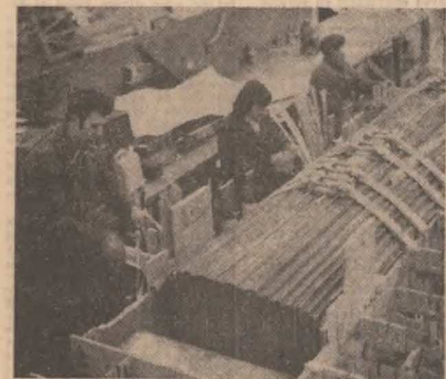
Imagine de la Fabrica de transformatoare a întreprinderii „Electropitere” Craiova.

De menționat că, oamenii muncii din cadrul Trustului de construcții locale și-au depășit sarcinile de plan aferente perioadei din acest an, predând la cheie, peste prevederi 134 de apartamente și garsoniere.