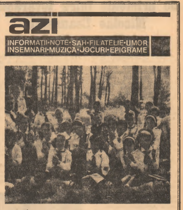
In tabără, cîntecul este un nelipsit însoțitor