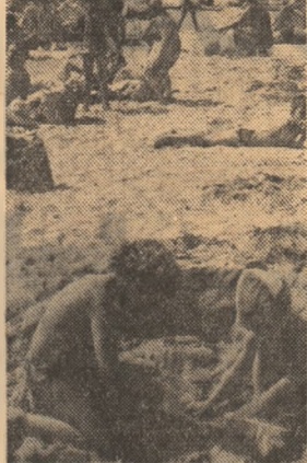
Aer, soare, mare.

Dincolo de hazul ei involuntar, întimplarea de la Brad rămîne tristă. O serie de adulți — părinți, medici, profesori — au reușit conform ideilor lor preconcepte, lipsei de răspundere sau birocratică, determinînd elevii tineri să abdice de la datorită lor, să fugă de muncă. Reacția colectivului în mijlocul cărora trăiesc aceștia a fost promptă și aspră. Prietenii, susțin așezii elevi, s-au deștărnat, poate pentru totdeauna. Așa se face? Au mai existat nici o cale de restabilire a relațiilor? Vă invităm să meditați la aceste întrebări și să ne trimiteți răspunsul dumneavoastră pe adresa: Redacția Științei tineretului, Piața Științei nr. 1, Sector 1, București.