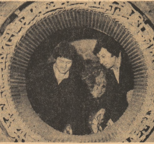
Turnarea bobinei-stator la Laminorul de tablă din Galați

La întreprinderea de țevi din municipiul Roman a fost extinsă răgătorita la rece, capacitate de producție de o deosebită importanță pentru realizarea materialului tubular socialist de economie națională. De menționat că aici se vor realiza țevi cu diametre mari, folosite în industrie, cărbune și în construcțiile de masă. Prin punerea în funcțiune a investiției, colectivul de la această întreprindere va realiza materialul tubular care plină acum se importa, contribuind la reducerea efortului valutar al țării.